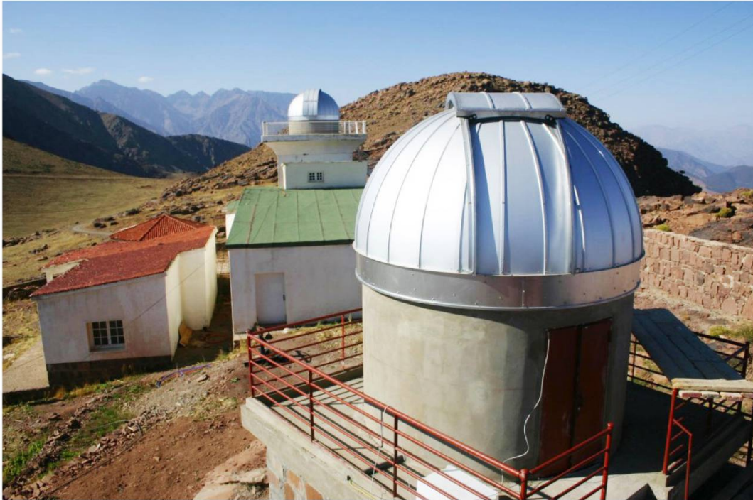
L'Observatoire universitaire de l'Oukaimeden est géré par l'Université Cadi Ayyad de Marrakech et se trouve à 2750 mètres d'altitude. Il abrite la coupole « Vicques Sud » du projet MOSS (au premier plan). En arrière-plan, les plus hauts sommets de la chaîne du Haut Atlas avec notamment les sommets du Toubkal, de l'Ouanoukrim et de l'Afella.