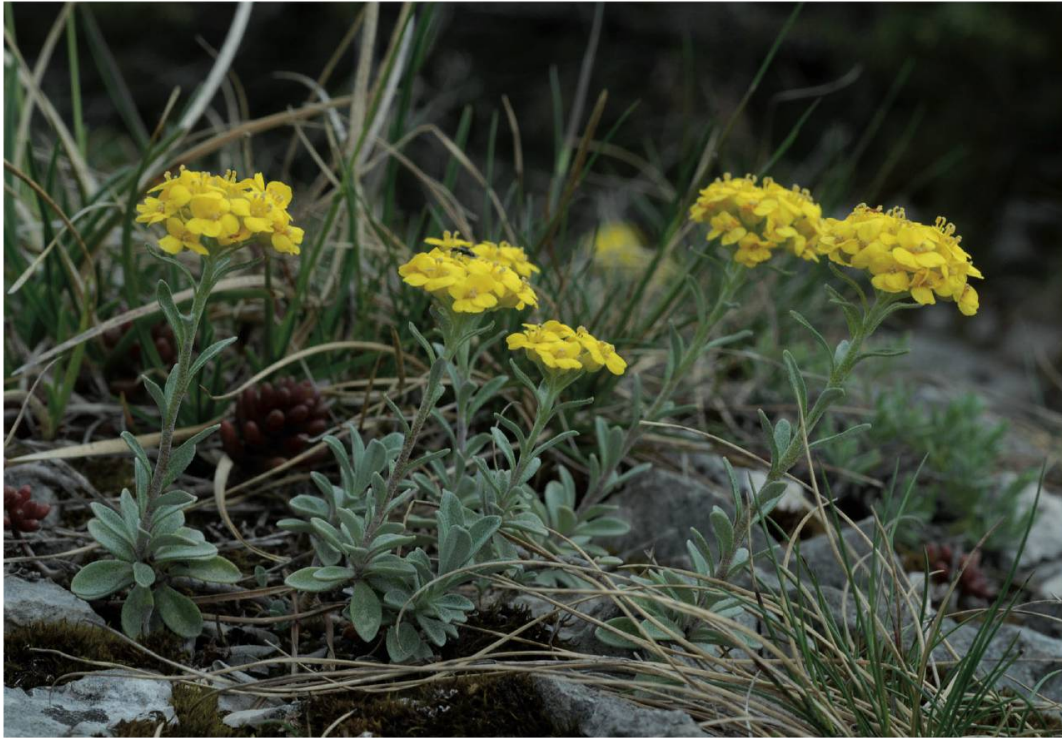
Fig. 1. Alyssum montanum , Ederswiler, Habschälle, avril 2009 – Philippe Juillerat.