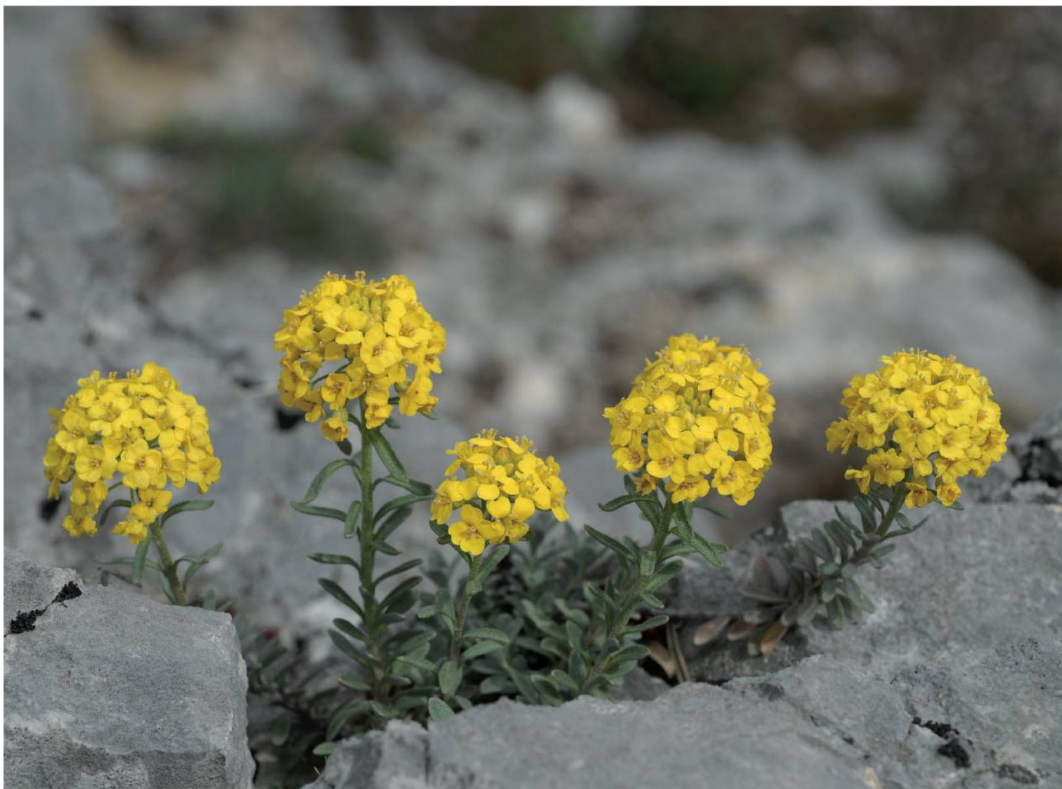
Fig. 2. Alyssum montanum , Ederswiler, Habschälle, avril 2009 – Philippe Juillerat.