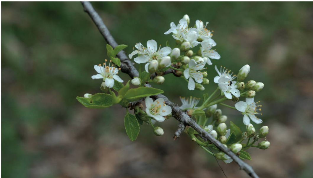
Fig. 6. Prunus mahaleb , Ederswiler, Habschälle, avril 2009 – Philippe Juillerat.