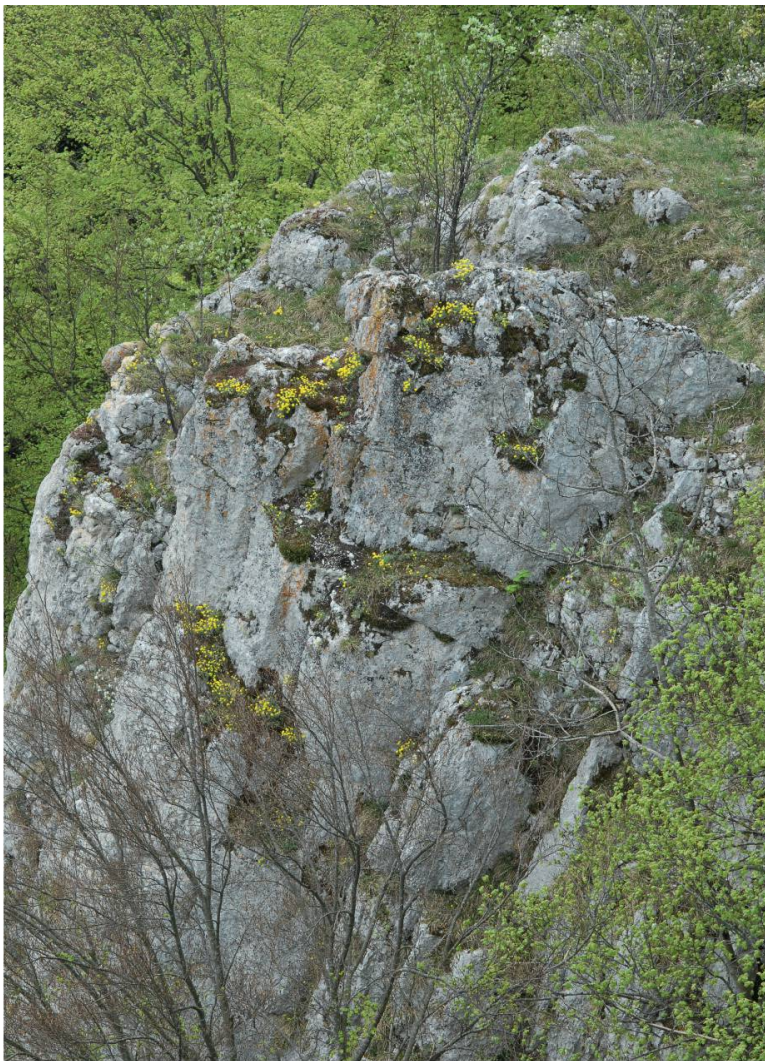
Fig. 3. Alyssum montanum dans la falaise du Raemelsberg à Kleinlützel, avril 2009 – Laurent Juillerat.