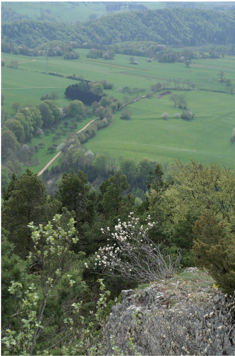
Fig. 5. Le promontoire d'Habschälle avec les champs de Movelier en arrière-plan, avril 2009 – Philippe Juillerat.