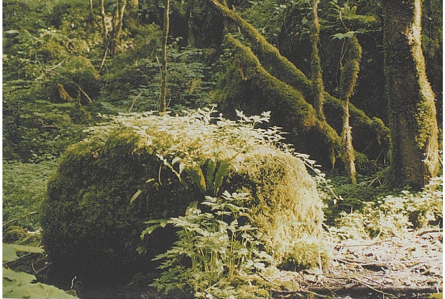
Fig. 3: Zone fraîche et humide où abondent mousses, lierre et fougères.

ment aux différentes saisons sur tous les sites des relevés pour constater les changements de la végétation.