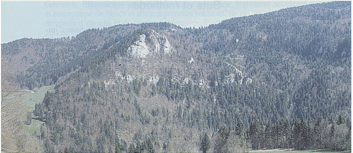
Fig. 2: Vue d'ensemble de la Réserve forestière du Theusseret, depuis la France (Valloreil).

ressemblance qui sert à la classification des relevés synusiaux est la présence ou l'absence commune des différentes espèces végétales.