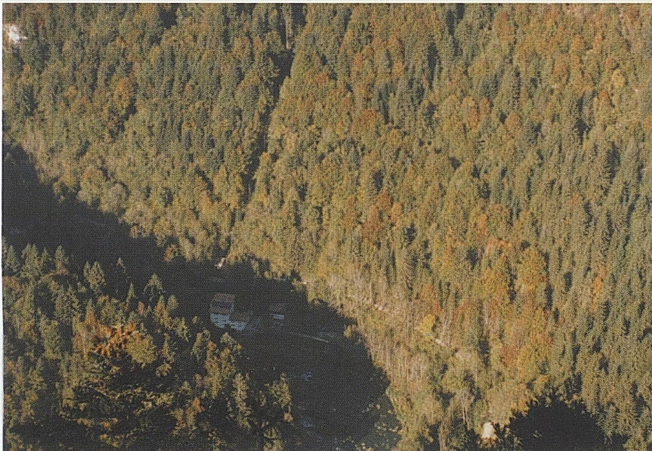
Fig. 1 : La vallée du Doubs au Theusseret.

Goumois. Elle occupe un versant calcaire très raide, fortement accidenté et entrecoupé de bancs et d'escarpements rocheux, de ravins, de combes, de cônes d'éboulis et de quelques terrasses. L'altitude est comprise entre 500 et 900 m et l'exposition varie d'Ouest à Nord. On y accède principalement par le chemin menant au restaurant du Theusseret ou par le sentier situé à l'extrémité ouest de l'arête des Sommêtres, au lieu dit «Chez le Bolé».