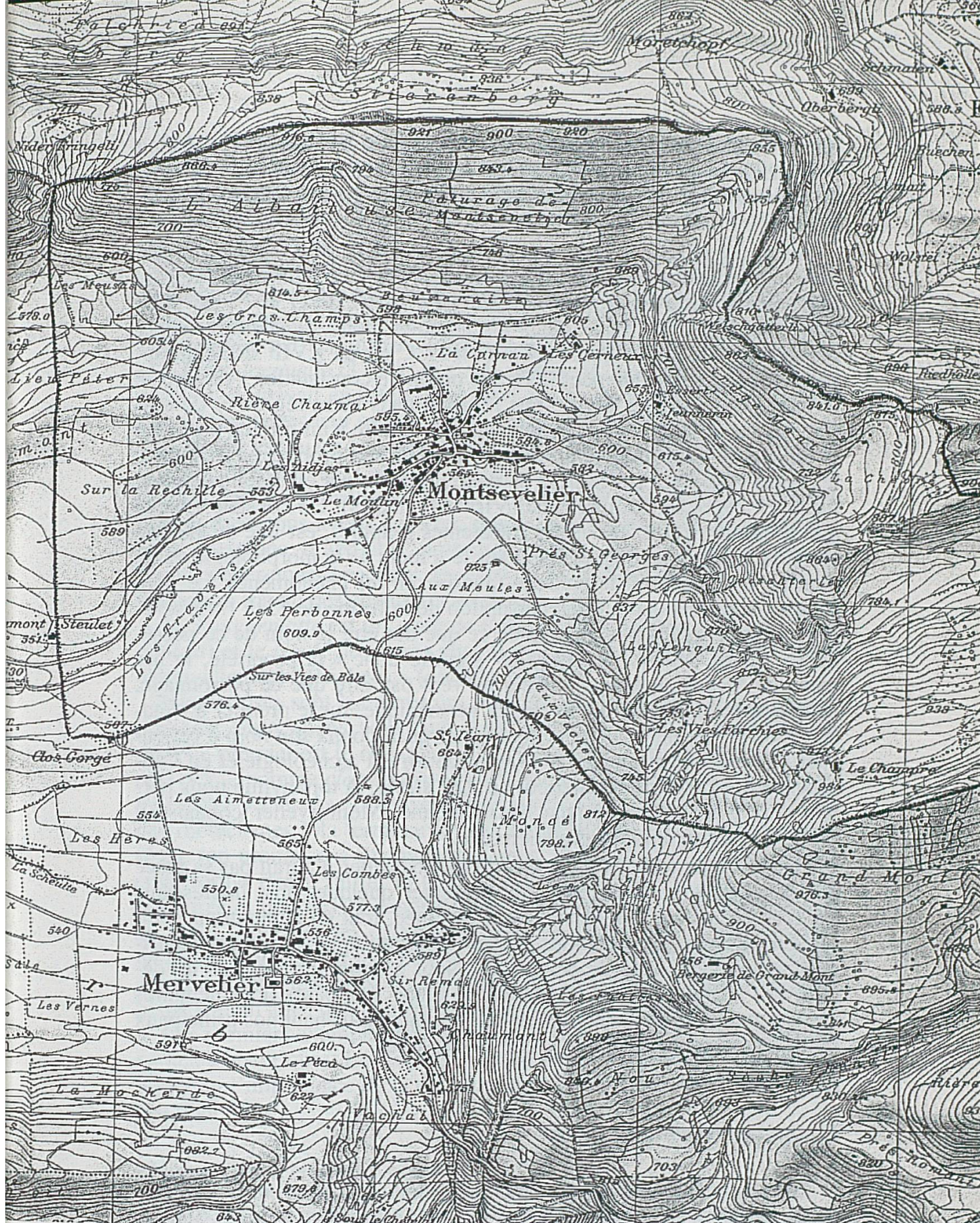
Extrait de la carte topographique au 1 : 25 000 de cette région.