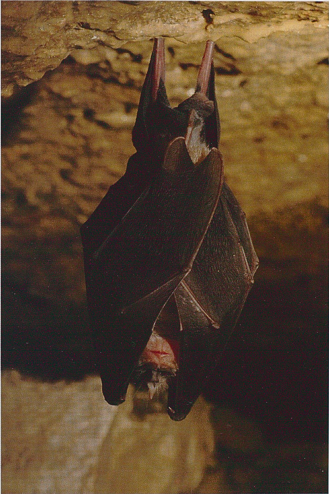
Fig. 5: Grand Rhinolophe Rhinolophus ferrumequinum en hibernation dans la Grotte de Réclère.