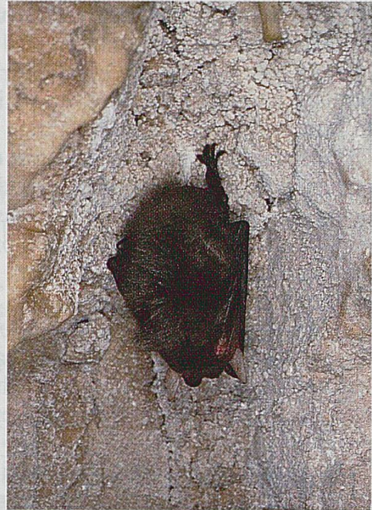
Fig 2: Oreillard brun Plecotus auritus.