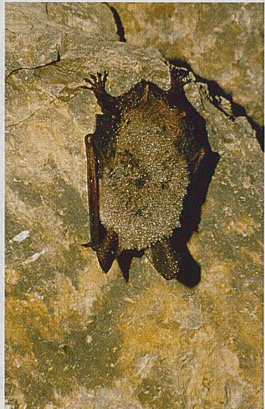
Fig 4 : Murin de Bechstein Myotis bechsteini.