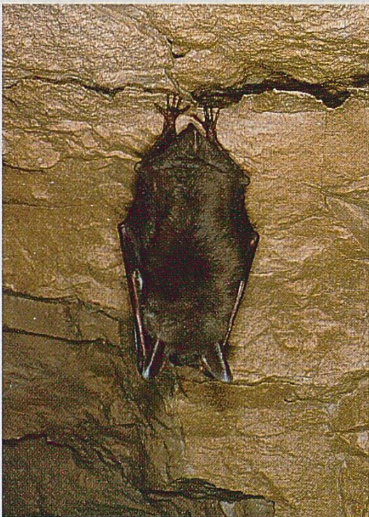
Fig 3 : Grand Murin Myotis myotis.