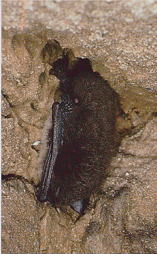
Fig. 1 : Murin de Daubenton Myotis daubentonii.