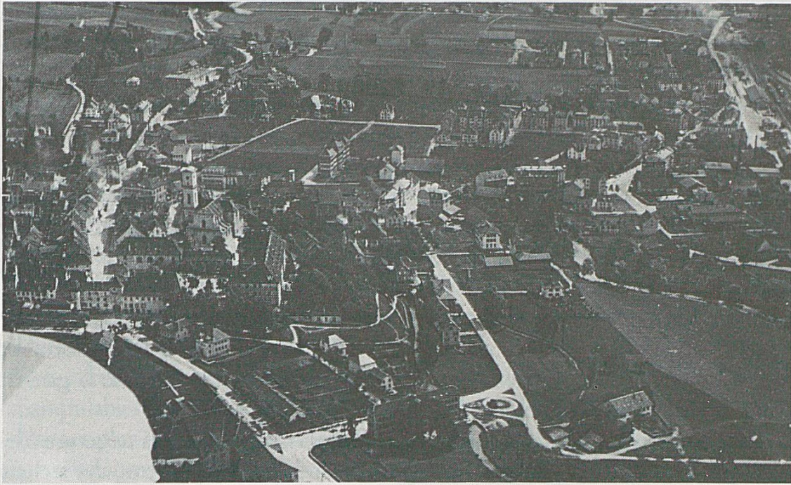
Delémont vers 1920 : à gauche, la vieille ville ; à droite, la gare et les nouveaux quartiers.