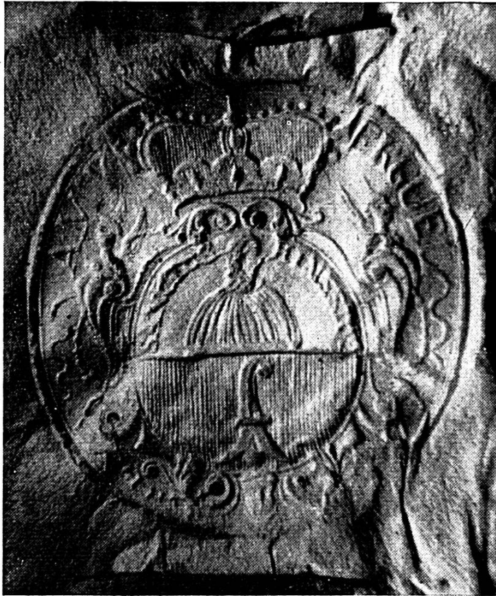
Fig. 4. Sceau de la seigneurie d'Erguel, (agrandissement), de juin 1725. (Photo de l'auteur).

vingts ans environ. En 1643, nous en trouvons un autre modèle, mais la crose est ici brochante sur un coupé, c'est-à-dire que le fond (ou le champ) de l'écusson est partagé horizontalement en deux parties et que la crose est posée par-dessus ces deux parties. Les couleurs de celles-ci ne sont pas indiquées, mais nous reviendrons plus loin à ce sujet. Quant au buste de saint Imier, il reste dans la même position. Nous trouvons encore ce sceau en 1719.