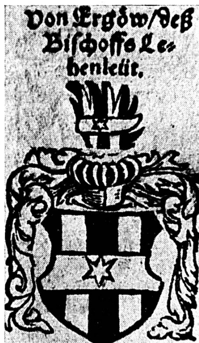
Fig. 1. Armoiries von Ergöw, d'après la Chronique suisse de Stumpf : à gauche édition de 1548, à droite édition de 1586.

Signalons que, dans un ouvrage de la même époque, la Chronique suisse de Johannes Stumpf, éditée en 1548, on trouve le dessin de ces armoiries, en gravure sur bois, à la page 412. Le nom y est écrit : von Ergöw . Ces armes sont reproduites également dans l'édition de 1586 de la même chronique, à la page 674 (fig. 1).