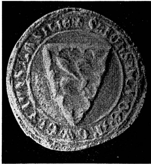
Fig. 3. Sceau de Jean d'Arguel, bourgeois de Bâle (agrandissement), sur un acte du 3 avril 1291 (d'après « Urkundenbuch der Stadt Basel » III).

Il est en outre probable que cet Henri est le même personnage que Henri, seigneur d'Arguel, des documents neuchâtelois de 1239 et 1249 (G.-A. Matile : « Monuments de l'Histoire de Neuchâtel » I, Nos 113 et 134). Dans le premier il est titré « dominus de Arguel » et dans le second figure également Bourcard de Diesse. Cet Henri doit certainement être rattaché à la famille des Arguel près de Saint-Imier.