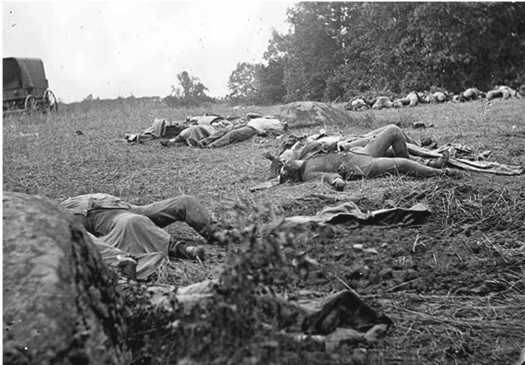
Photographie d'Alexander Gardner, champ de bataille vers Emmittsburg, juin-juillet 1863. [ http://www.sonofthesouth.net ].

A la suite de nouvelles lois votées par le Congrès jusqu'à la veille de la Première Guerre mondiale, le système de pensions mis en place devient de plus en plus généreux envers les vétérans. Ainsi, à partir de 1890, un ancien combattant peut recevoir une rente pour incapacité de travail totale ou partielle en raison d'une dégradation de sa santé physique ou mentale liée à l'âge, sans lien avec des séquelles de son passage dans l'armée. Ces améliorations