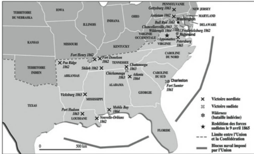
Carte 2 : Les batailles 5