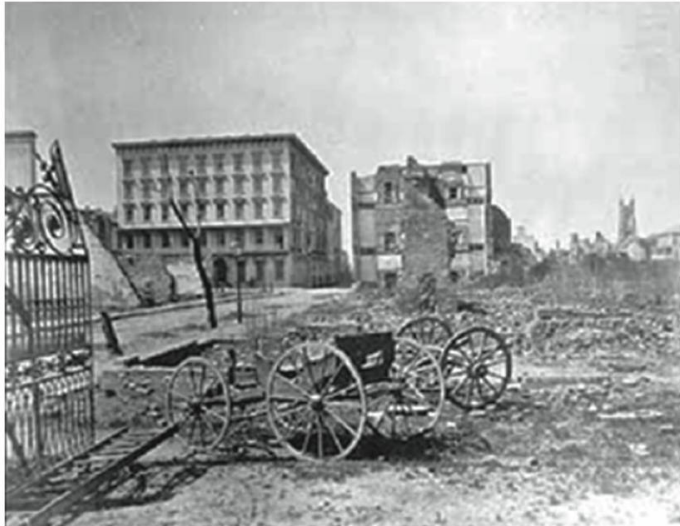
Charleston, 1865