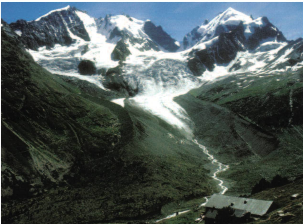
Fig. 2a et b: La fonte des glaciers, indice du réchauffement (Glacier de Tschernia/GR en 1910 et en 2001).