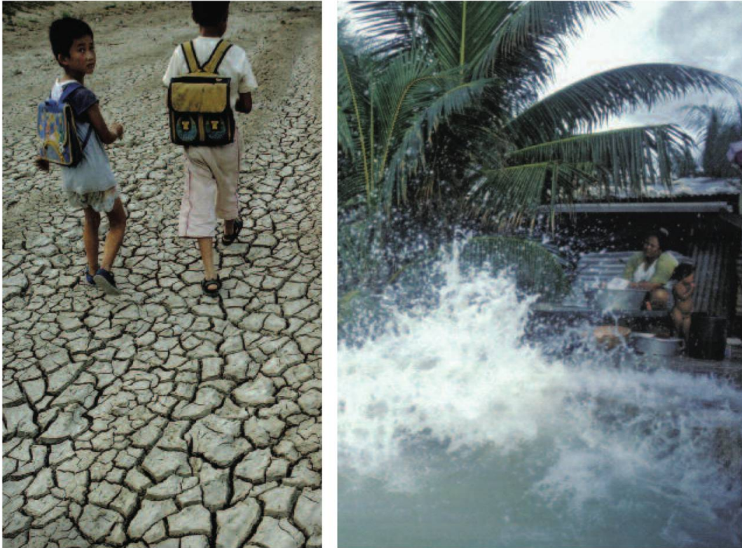
Fig. 3a et b: Sécheresse destructrice (Chine) et montée des océans (Funafuti).

de ne relever que des sciences de la vie pour pénétrer celles de l'homme et de la société. Pour légitime que soit cette appropriation du concept par les sciences humaines, elle nécessite de positionner l'écologie par rapport à l'écologisme. L'écologie est une science dont on considère traditionnellement qu'elle naquit à la fin du XIX e siècle sous l'impulsion du biologiste allemand Haeckel. Elle est dotée d'un corpus théorique bien structuré qui répond aux exigences de la démarche scientifique telles qu'elles furent précisées au cours du XX e siècle par les philosophes des sciences comme Thomas Kuhn (1974) et Karl Popper (1972), et est solidement implantée dans les universités et instituts de recherche. L'écologisme, quant à lui, est un mouvement d'opinion né de la conscience populaire d'une dégradation continue de la nature. Né dans le courant du XX e siècle aux Etats-Unis, notamment sous l'impulsion d'Aldo Leopold (1949) qui est souvent considéré comme le père des mouvements de conservation de la nature, ce mouvement se développa dans les années soixante à la suite de cris d'alarme populaires comme le fameux Silent Spring (Le printemps silencieux) de Rachel Carson (1962). Ecologie et écologisme ne s'opposent pas nécessairement si on prend garde de ne pas mélanger les genres, car ce sont deux manières distinctes, complémentaires et légitimes, de regarder la nature et ce que l'homme en fait.