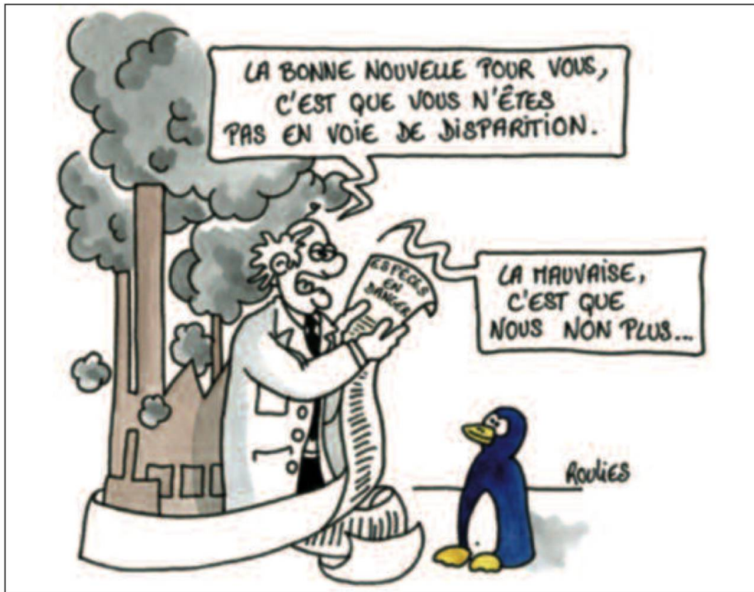
Fig. 4 : La biodiversité, un héritage que nous avons le devoir de léguer à nos enfants...

4) un enjeu éthique relatif au droit à la vie des espèces. Il s'agit là de questions d'ordre sociologique, philosophique et théologique qu'on ne peut d'autant moins éluder que, sur les six milliards de nos contemporains, plus de cinq milliards inscrivent le respect de la nature dans leur spiritualité, celle des religions du Livre bien sûr, mais aussi toutes les autres.