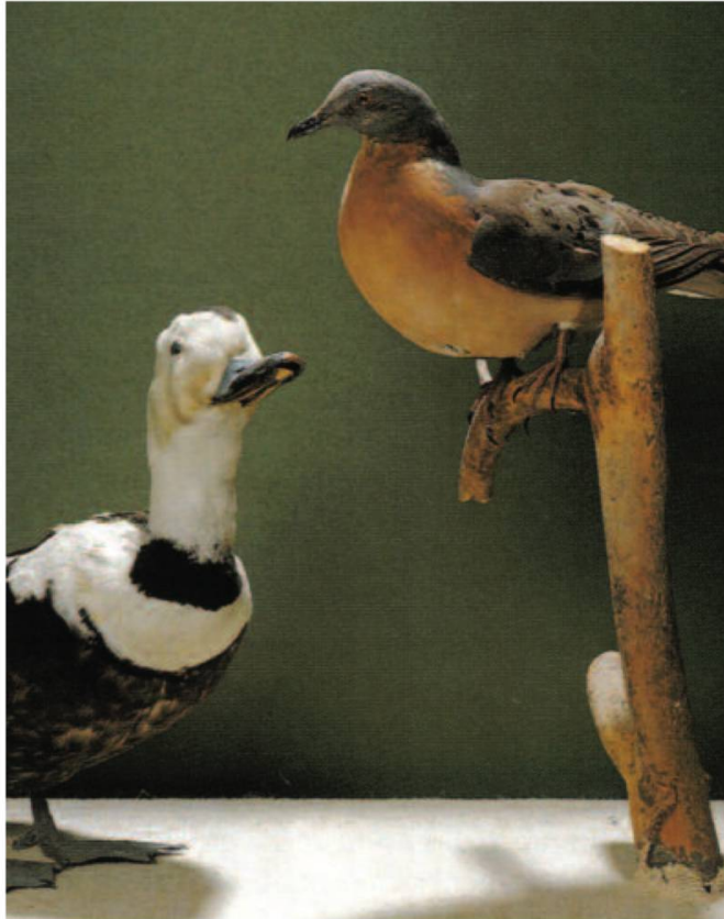
Fig. 5a et b: Le canard du Labrador, la tourterelle migratrice et le zèbre couagga, espèces dont la disparition est liée à l'action de l'homme.