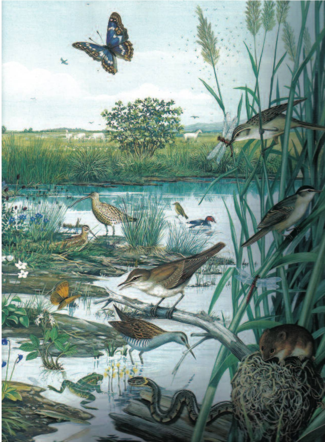
Fig. 6: Espèces menacées!