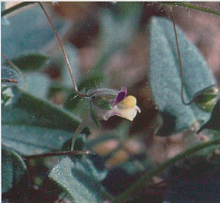
Fig. 4 : Kickxia elatine , Bonfol, août 2003.