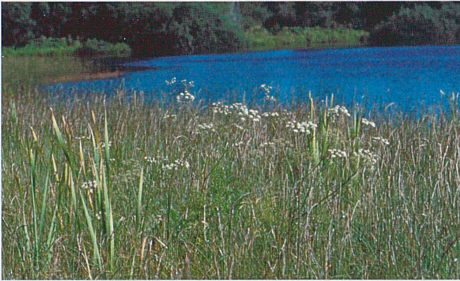
Fig. 3 : Cicuta virosa , Le Bémont, Les Royes, août 2002.