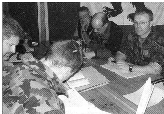
An der Züspa 2007 in Zürich trugen auch Logistik-Offiziere zum guten Gelingen bei. Weitere Berichte über diese eindrückliche Messe in dieser Ausgabe von ARMEE-LOGISTIK auf Seite 9 und dritter Umschlagseite.

Allseits herzliche Gratulation und auf Wiedersehen im nächsten Jahr!