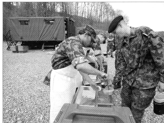
Bedarfsverpflegung bedeutet, dass die Truppe jederzeit eine der Lage, dem Auftrag und dem Grundbedürfnis angepasste Kostform erhält.

Der Leiter Verpflegungszentrum verfügt über hohe Sys-