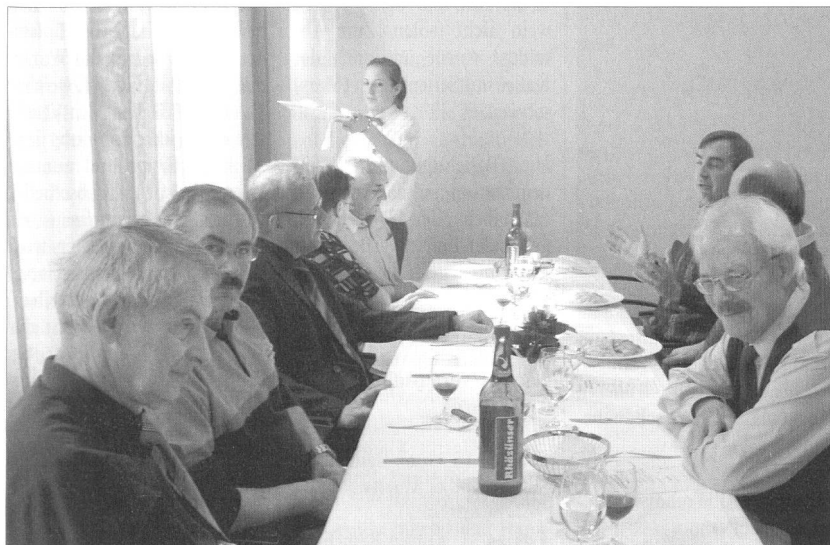
Bei einem feinen Mittagessen liessen die Teilnehmer Gedankenaustausch und Kameradschaft hoch leben.