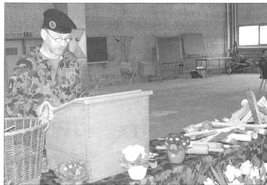
Ab der 5. Woche musste jeder Anwärter ein Stück Holz mitbringen, mindestens die Grösse einer Faus oder maximal Ofengrösse.

Mit dem Dank des Präsidenten für das Erscheinen an der Generalversammlung, der guten Zusammenarbeit im Vorstand und der Mitglieder an den Kochanlässen konnte er die 16. ordentliche Generalversammlung schliessen.