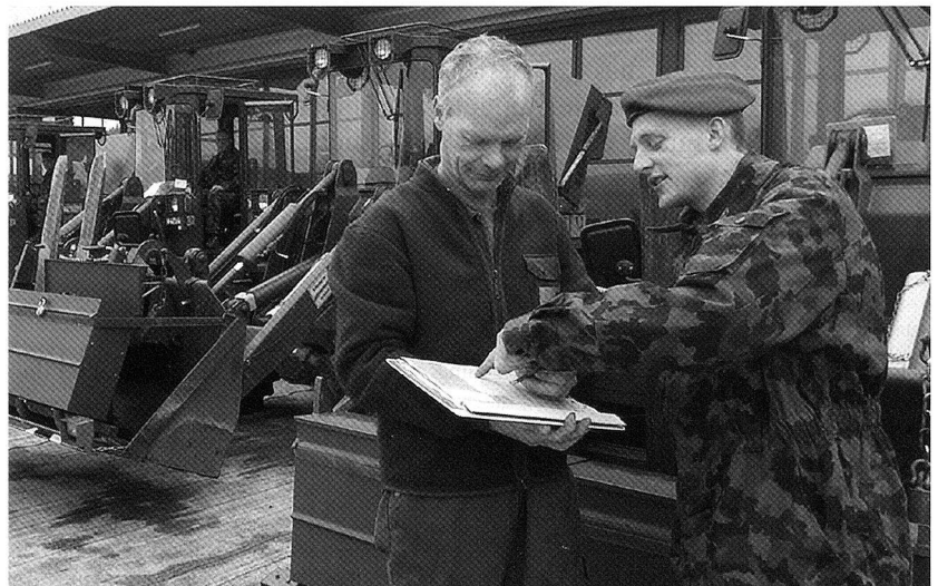
Für die LBA ist ein professionelles Rückmeldeverfahren durch ihre Kunden sehr wichtig.

Weitere Infos über die Logistik können abgerufen werden auf: www.logistikbasis.ch