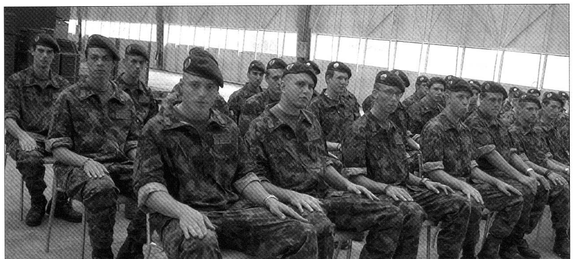
Endlich geschafft: Küchenchef-Anwärter an der Korpsvisite und Beförderungsfest des Küchenchef-Lehrgangs 1/07.