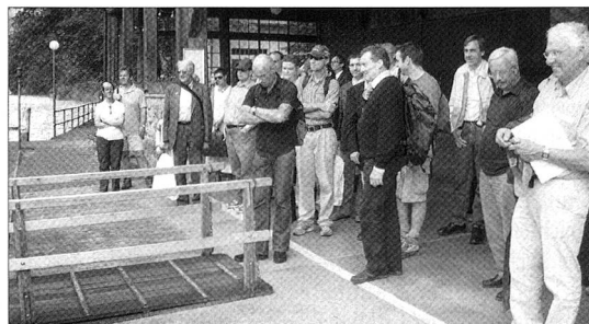
Eine bunt gemischte Schar nach getaner Arbeit an der Schiffstation Giessbach im Berner Oberland.

La matinée fut consacrée à des travaux en groupes. Un premier groupe suivit un exposé de Monsieur le Colonel Heinrich Wirz, publiciste militaire et rédacteur au Palais fédéral pour notre organe. Monsieur le Colonel Wirz nous fit participer à un «brainstorming» destiné à rassembler des idées