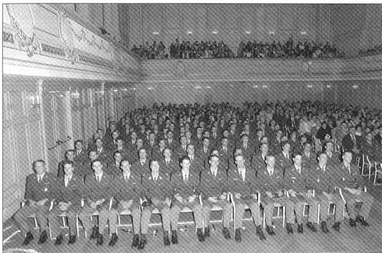
Ein Blick in den Grossen Saal des Casinos-Kursaal Bern, der zum Bersten voll war.