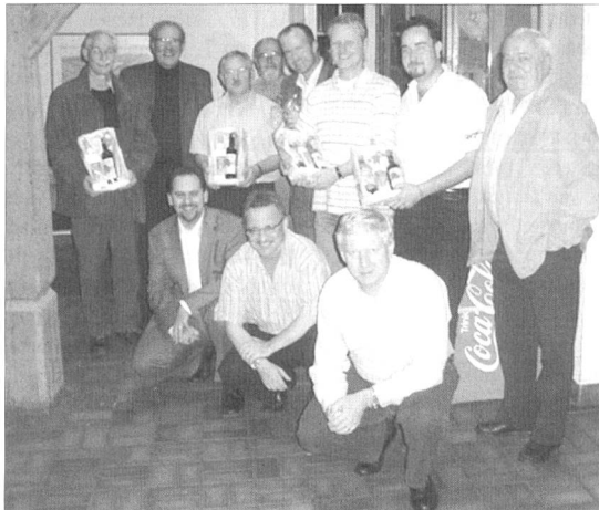
Wenn man dieses Siegerbild anschaut, scheint sich es doch zu bewahrheiten, dass die Rüebliländler viele und gute Jasser haben.