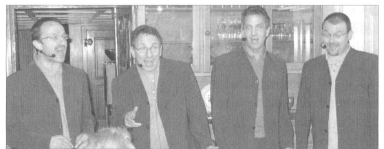
Das Gesangs-Quartett «four for you» erfreute die Anwesenden mit drei Gesangsblöcken.

Gesprächsstoff gab es genügend beim anschliessenden Imbiss, der durch die Sektion offeriert wurde, im nahe gelegenen Restaurant Fass.