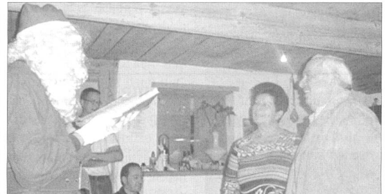
Nicht nur Kinder, auch Erwachsene können Freude zeigen beim Besuch des Samichlases.