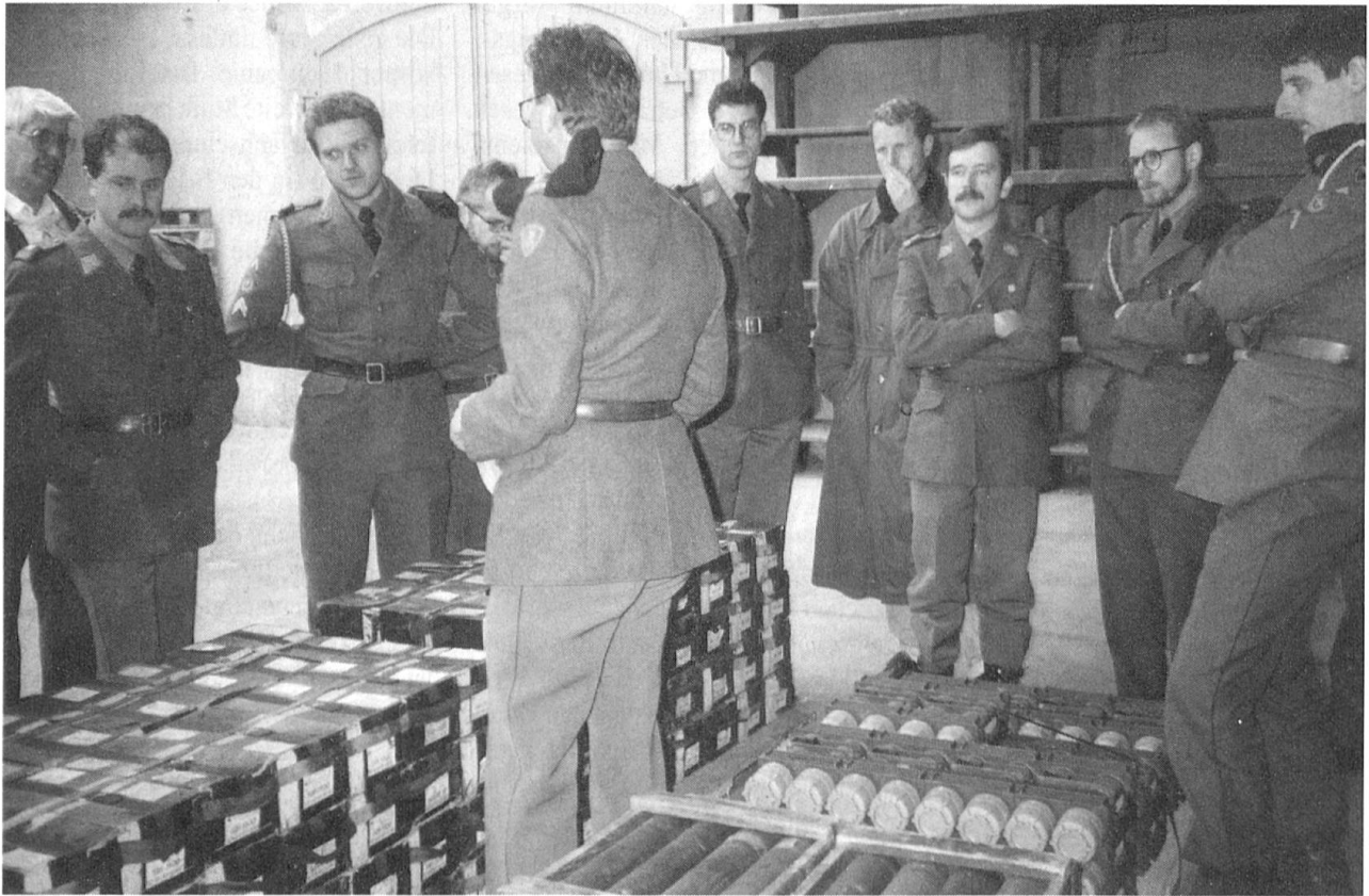
... oder ausserdienstlich zur Weiterbildung in Uniform...

für die Dauer der jeweiligen Ausbildung in Schulen der Versorgungstruppen dem Oberkriegskommissär unterstellt, bleiben aber personell bei ihrer angestammten Truppengattung.