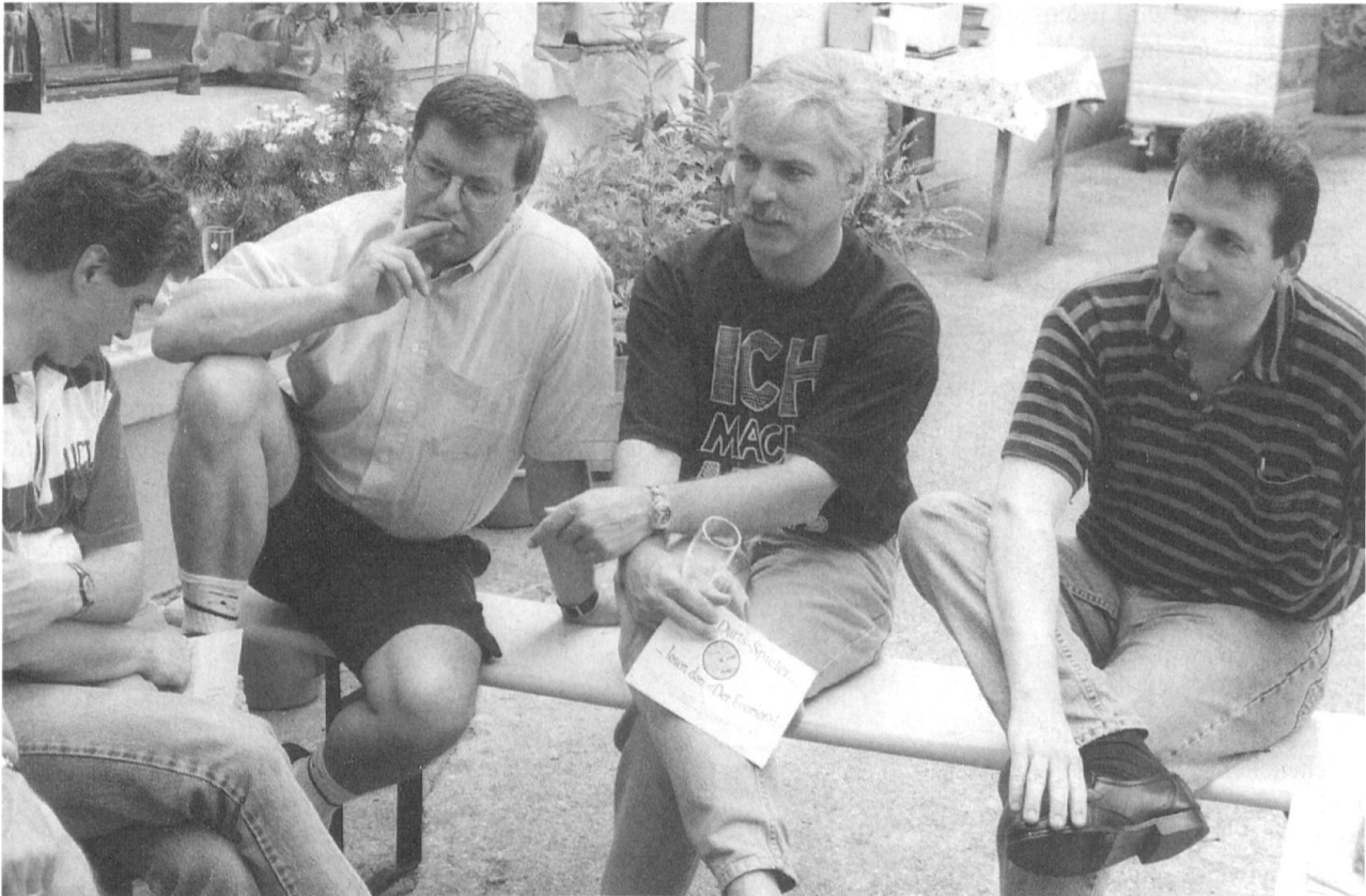
... und in Zivil.