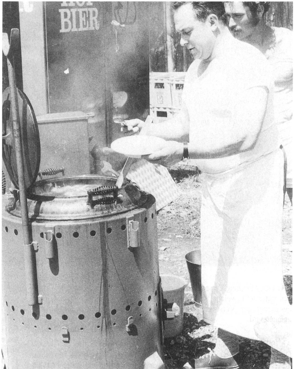
Auch im Zivilleben profitieren Schützen-, Wald- und Wiesenfeste vom Know-how der «Hellgrünen».