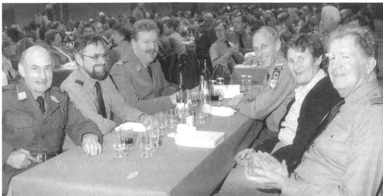
Mindestens einmal im Jahr, nämlich anlässlich der Delegiertenversammlung des Schweizerischen Fourierverbandes, treffen sich gesamtschweizerisch Quartiermeister und Fouriere zur Beratung anstehender Probleme und Diskussionen über die Belange des Hellgrünen Dienstes unserer Armee...

Seit den 80er Jahren ist die Ausbildung der «hellgrünen» Kader (Quartiermeister, Fouriere und Küchenchefs) auf den Waffenplätzen Thun und Bern konzentriert. Eine personelle Besonderheit ist noch von Interesse: Der Oberkriegskommissär ist bezüglich Versorgungstruppen nur für die Offiziere der Versorgungstruppen, die Quartiermeister, Kommissariatsoffiziere und Kriegskommissäre gleichzeitig Waffenchef; die Küchenchefs, Fouriergehilfen und Fouriere sind nur