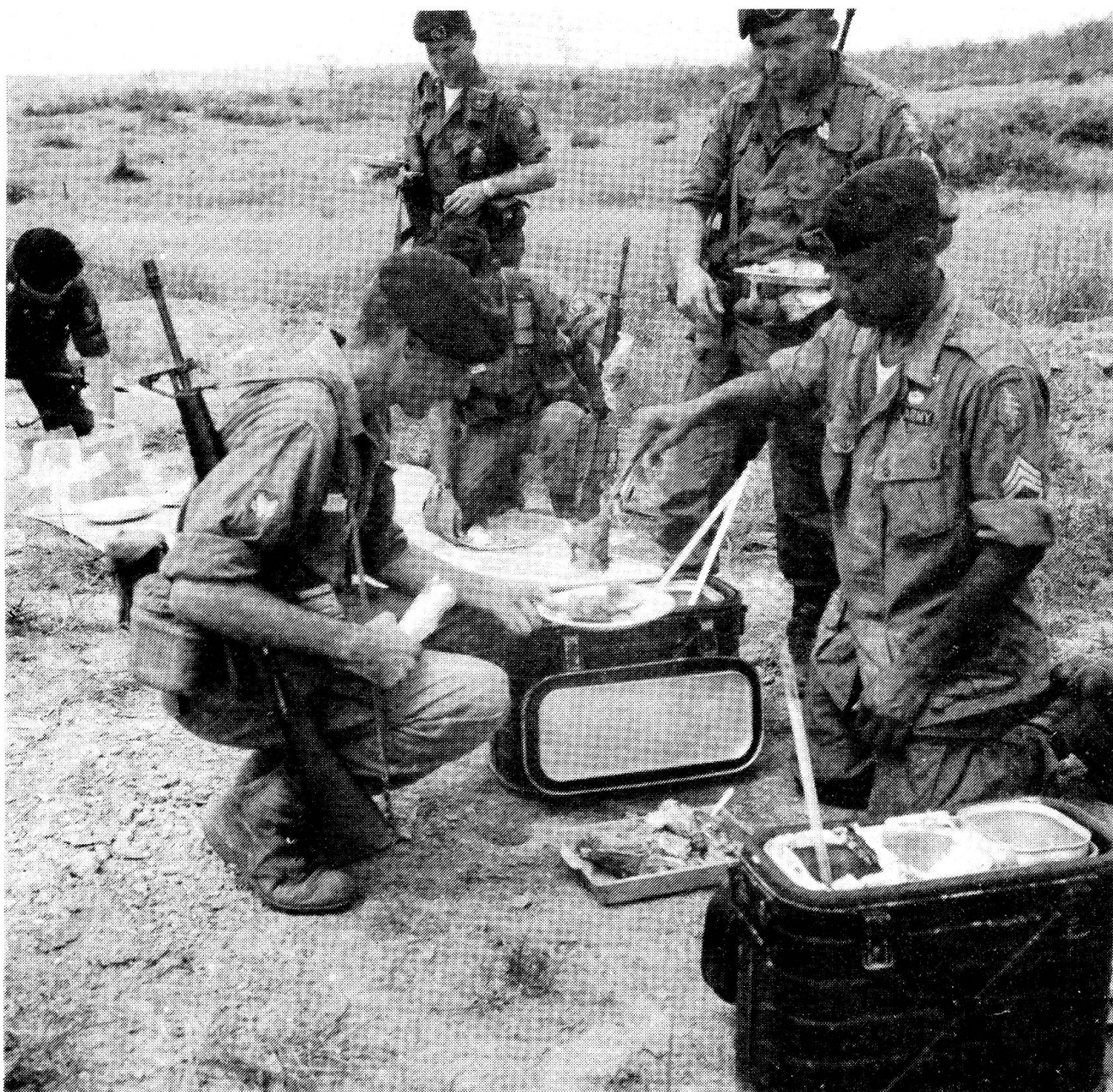
Thanksgiving-Mahl von Männern eines «A-Teams» in der «Kriegszone D» im Vietnamkrieg.

land abspielten. Die beweglichen Guerillakompanien sickerten unbemerkt auf dem Land- oder Luftweg in feindbeherrschten Regionen ein und unterbrachen die Versorgungs- und Verbindungslinien des Vietkongs. Dabei fügten sie dem Gegner schwere Verluste zu und gerieten auch selbst oftmals in recht «haarige» Situationen, die mehrere Male in grosse Schlachten konventionellen Stils mündeten, manchmal mussten die Einheiten auf dem Luftwege evakuiert werden. Eine besonders erfolgreiche Serie waren die mit dem Codenamen «Blackjack» bezeichneten Unternehmen. Gewöhnlich hielten sich dabei Teams für längere Zeiträume meist unerkant im feindbesetzten Gebiet auf und führten zahlreiche Sonderaktionen durch.