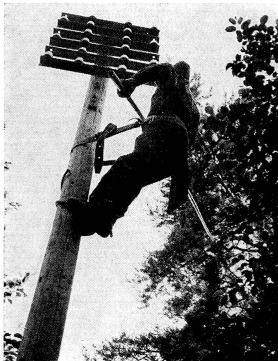
Der Freileitungsmonteur an der Arbeit.