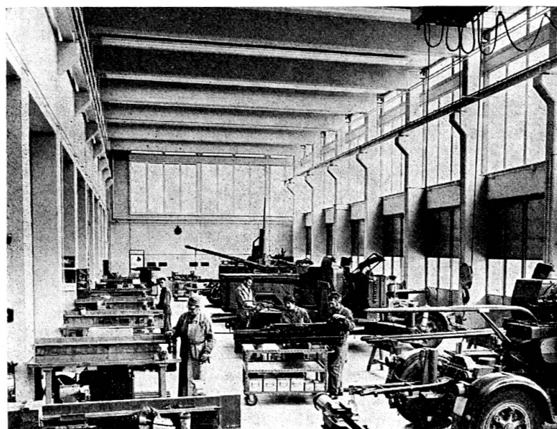
Geschützinstandstellung einst und heute