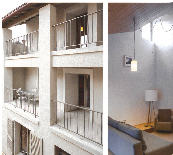
3. Sergison Bates architects, casa a Monte, Castel San Pietro 2014.