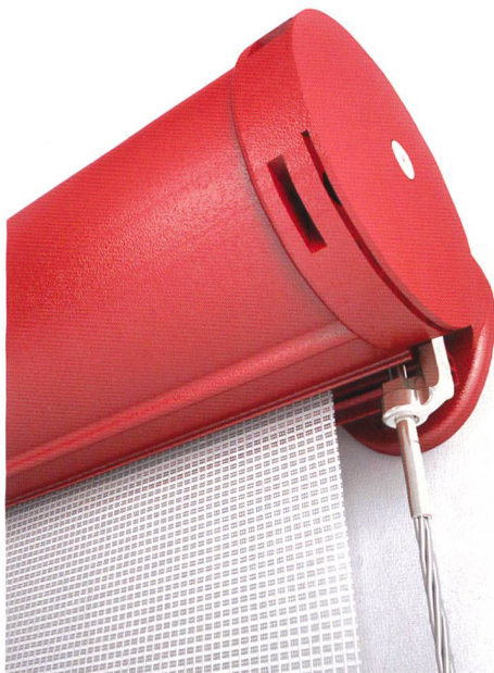
In evidenza: SCHERMATURE.

Per progetti personalizzati e standard in diverse misure e anche per l'installazione in spazi difficili da raggiungere. Estetica eccellente , nei materiali alluminio, acciaio con zincatura cromata oppure verniciata a polvere.