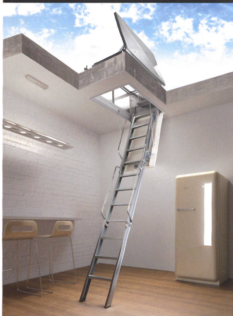
In evidenza: SCALE.

CONTATTACI PER UNA CONSULENZA PROGETTUALE.