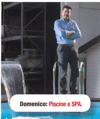
Domenico: Piscine e SPA.

FINESTRE DI NUOVA GENERAZIONE. PIÙ LUCE E PIÙ VALORE ALLA TUA CASA. 10% di superficie vetrata in più significa ancora più luce naturale e un clima interno migliore in casa. Nuovo design interno ed Efficienza energetica.