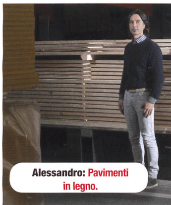
Alessandro: Pavimenti in legno.