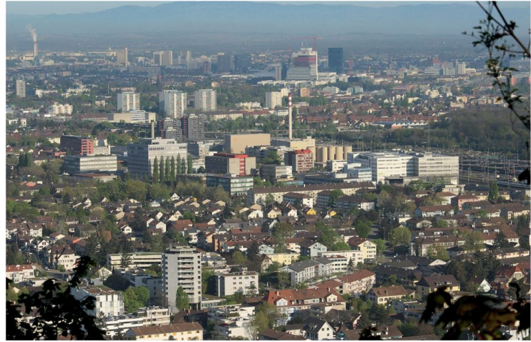
Il quartiere Polyfeld di Muttenz: un esempio di densificazione centripeta qualitativa.

La grande sfida dei progettisti è insita nei numerosi agglomerati risalenti agli anni Cinquanta e Sessanta, edifici che, per la maggior parte, non sono più in grado di soddisfare le attuali esigenze, né dal punto di vista energetico, né per quanto concerne le planime-