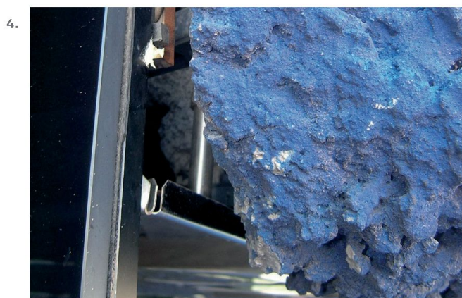
3. Sauerbruch Hutton, Museo Brandhorst, Monaco di Baviera, dettaglio sulla stratigrafia dell'involucro.