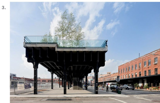
1. - 3. The High Line: Section 2, Falcone Flyover, veduta aerea del tratto tra la West 25th e la West 27th Street; Section 1, Washington Grasslands, veduta aerea su Little West 12th Street; Section 1, parte terminale tra Gansevoort e Washington Streets.