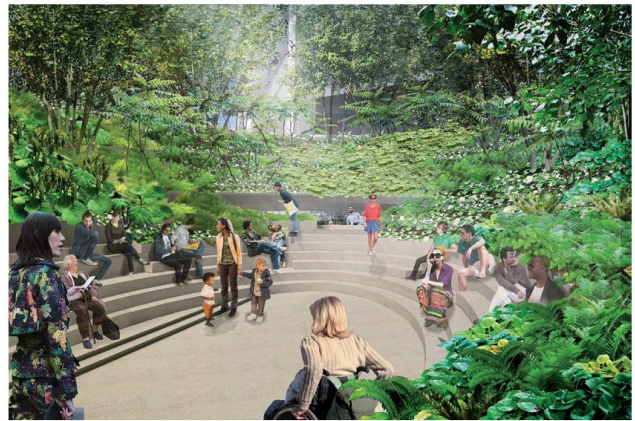
4. - 5. Rendering del tratto finale della High Line a nord-est con vista interna ed esterna di «The Spur», sorta di anfiteatro ricoperto di vegetazione e sormontato dai nuovi grattacieli. © James Corner Field Operations and Diller Scofidio + Renfro. Courtesy of the City of New York and Friends of the High Line