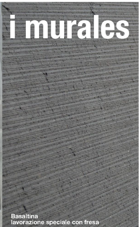
Basaltina lavorazione speciale con fresa