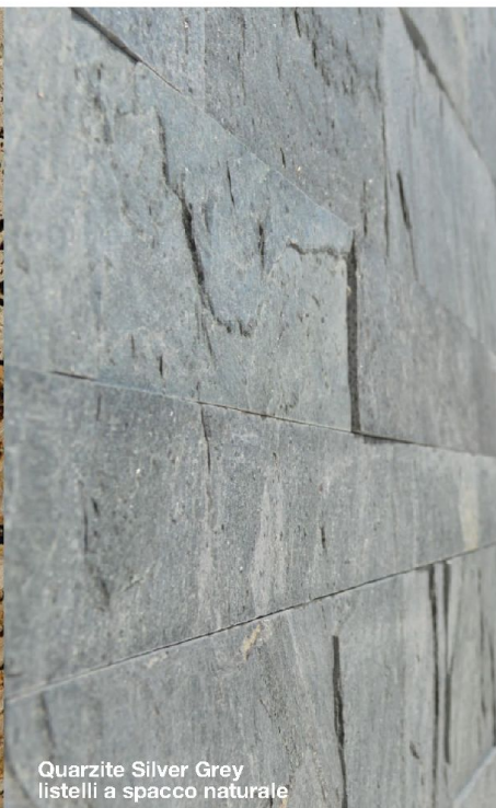
Quarzite Silver Grey listelli a spacco naturale