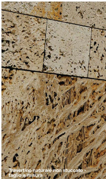
Travertino naturale non stuccato - taglio a misura

Blue Marlyn Project Via F.M. Preti n. 2/A 31033 Castelfranco Veneto Treviso, Italia t. +39 (0)423 1950 206 f. +39 (0)423 1950 206 project@bluemarlyn.eu www.bluemarlyn.eu