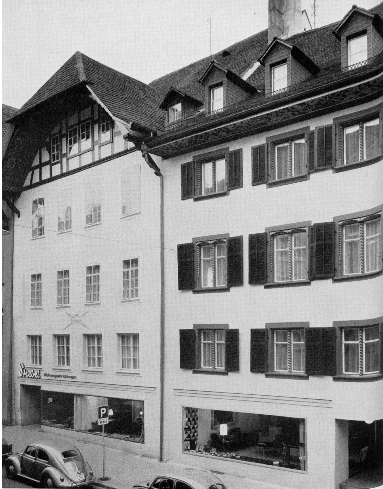
Vorbildlich renovierte Fassade an der Rathausgasse