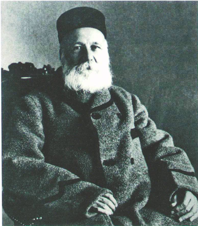
JOHANNES HEINRICH DUNANT DER SAMARITER VON SOLFERINO BEGRÜNDER DES ROTEN KREUZES UND URHEBER DER GENFER KONVENTION.

«Der Held Dunant» in unserer Erinnerung.