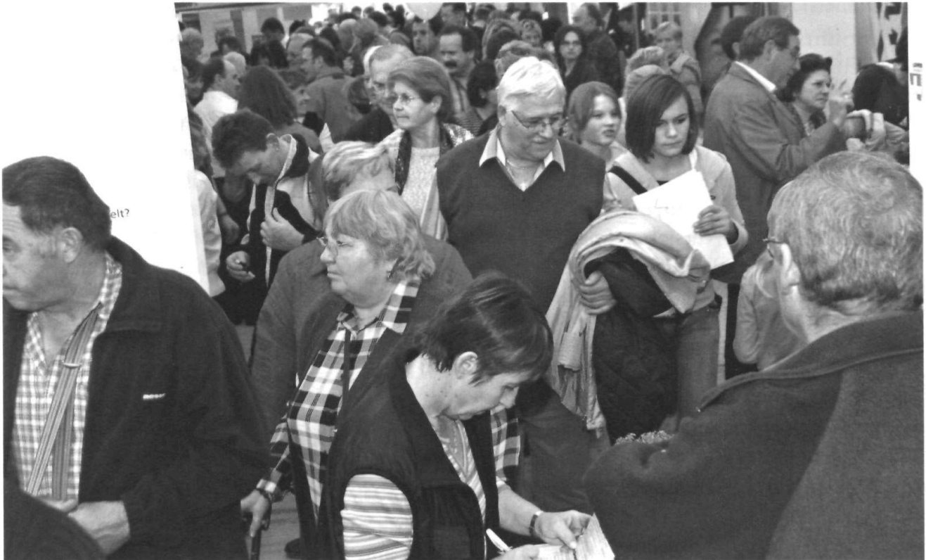
Am zweiten Novemberwochenende ging in Appenzell die vierte und bisher grösste Gewerbesmesse mit dem Titel «A05» über die Bühne.

Parfümerie und Kosmetika, war bisher nur mit der Administration in Appenzell ansässig. Mit der Konzentration auf den Standort Appenzell werden acht bis zehn Arbeitsplätze im Lager geschaffen, acht Mitarbeiter und eine Teilzeitkraft besorgen den Bürobereich. Realisiert wurde der Neubau auf kantonseigenem Boden, der für Belange der Wirtschaftsförderung reserviert ist. Die Obhut über den Zollbereich (im Lager können Waren unverzollt liegen bis zum Zeitpunkt der Auslieferung) liegt beim Zollamt St.Gallen.