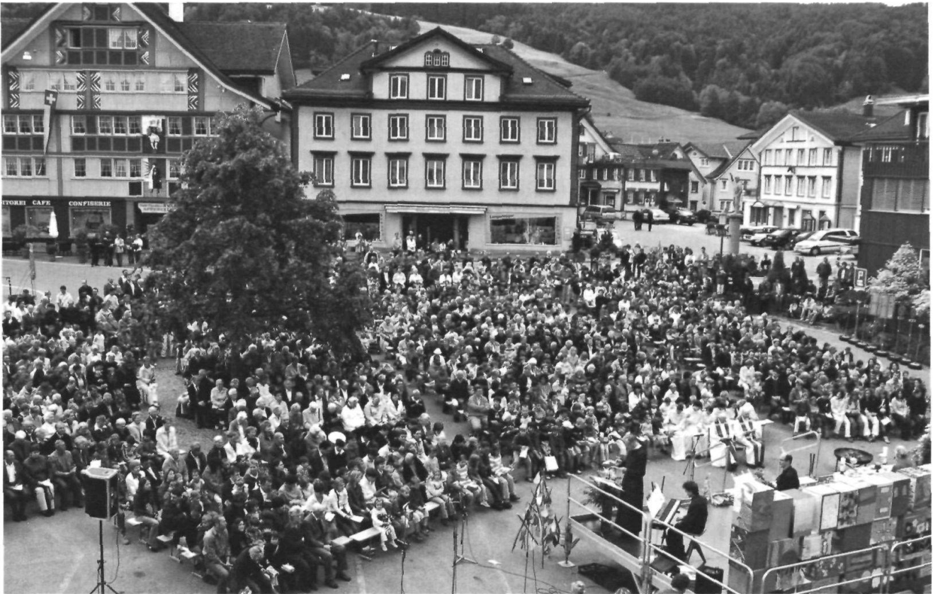
Das Glaubensjahr der katholischen Kirchgemeinde St. Mauritius unter dem Titel «Füür ond Flamme» ging am 5. Juni mit einem überaus gut besuchten Gottesdienst auf dem Landsgemeindeplatz zu Ende.

der seelsorgerisch-kirchenrechtlichen und administrativ-staatsrechtlichen Bereiche vollzogen werden. Kirchgemeinden, welche zum Zusammenschluss bereit sind, sollen im staatsrechtlichen Bereich eine Regionalkirche bilden, als Pfarreien aber bestehen bleiben. Für die Pastoration wäre ein zentrales Seelsorgeteam zuständig, das eine bedarfsgerechte Gottesdienstordnung aufrecht erhält. Erhofft werden grosse Erleichterungen im administrativen Bereich und eine markante Entlastung der Aussengemeinden. Das finanzstarke Appenzell müsste einen leicht erhöhten Steuerfuss hinnehmen, die andern hätten nur mehr einen Bruchteil der bisherigen Last zu tragen.