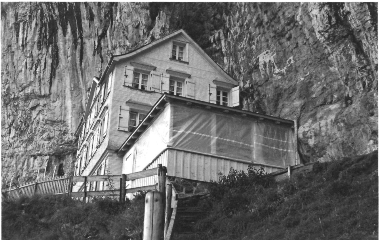
Die Bautätigkeit am Berggasthaus «Äscher» gab in der Öffentlichkeit verschiedentlich Anlass zu Diskussionen.

Bautätigkeit: In der ruhigen Frühsommerzeit wurde am Berggasthaus «Äscher» gebaut. Die ganze Fassade des Hauptgebäudes wurde saniert, Fenster nach neuesten Standards eingesetzt und neue Läden (mit den alten Beschlägen) eingehängt. So konnte alte Handwerkskunst gelebt werden, die sich im hellen Schindelschirm und in den Details der Fassade