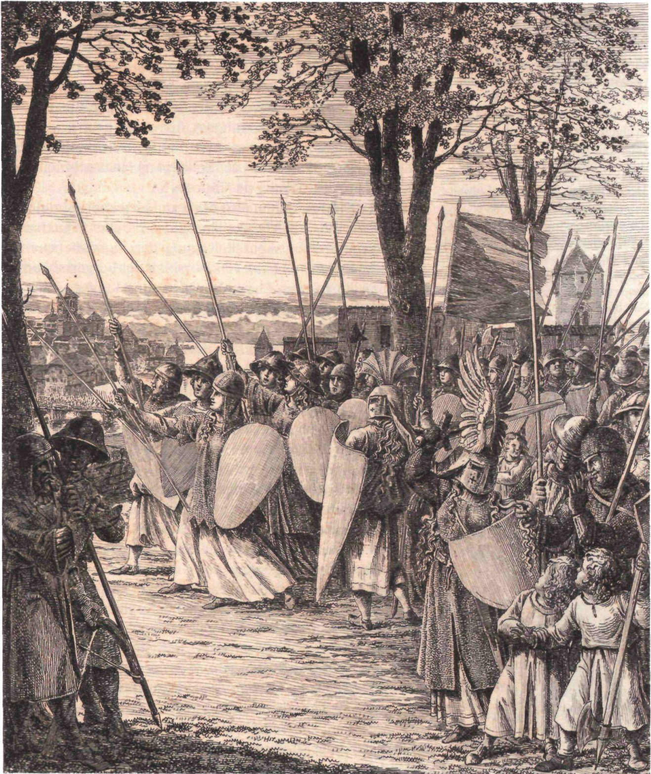
«Die Kriegerinnen auf dem Lindenhof» von Heinrich Freudweiler (1755–1795), vor 1795, aus dem Neujahrsblatt der Stadtbibliothek Zürich von 1824.