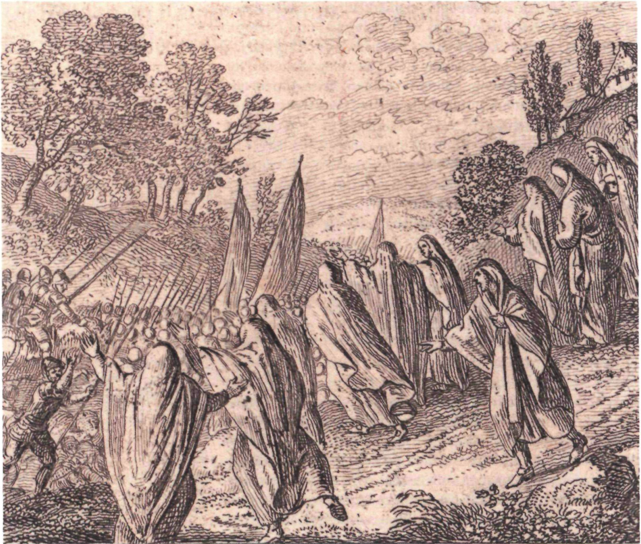
Kupferradierung von Johann Rudolf Schellenberg (1740–1806), 1786.

58 «Dem Sempacher Verein am Stoss im Kanton Appenzell» 1826. S. 1.