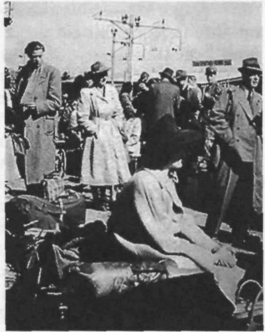
Anreisende Flüchtlinge nach Kriegsende.