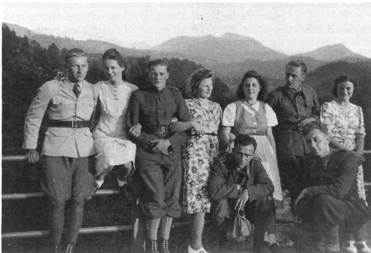
Treffen am Gübsensee. (Radzik)

Der «schwarze» Befehl war gegen die Natur des Menschen. Sich dagegen aufzulehnen und die Heerespolizei auszutricksen, übte einen unwiderstehlichen Reiz aus. «Man hat doch heute keine Ahnung mehr, wie das