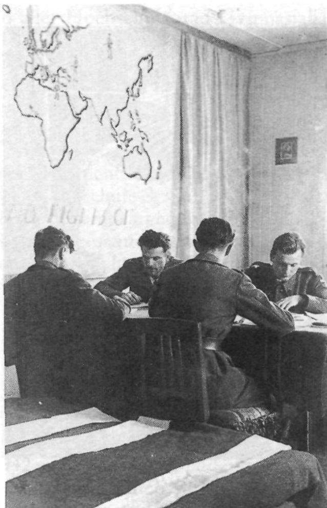
Studierzimmer in der stillgelegten Fabrik Zähler und Schiess & Co., Herisau 1942. (Rucki)