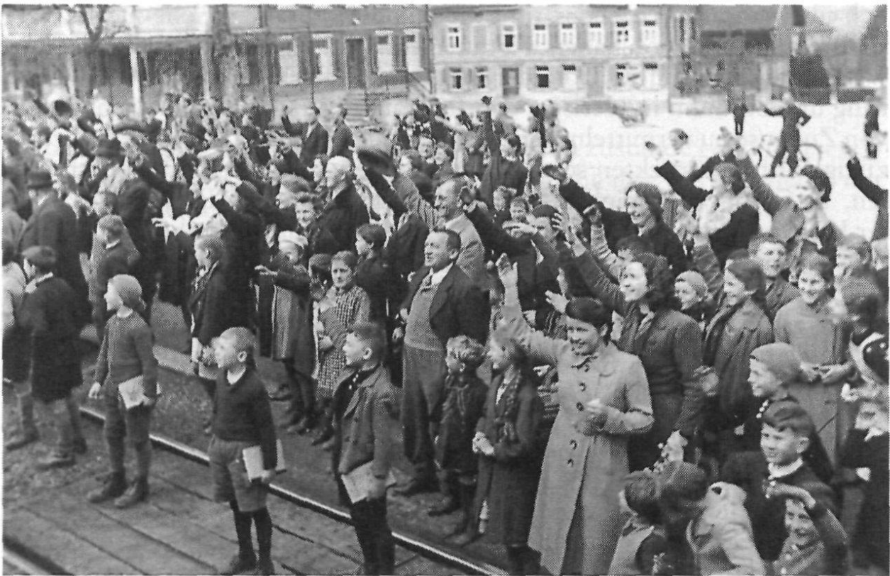
«Die Versetzung aus Sirnach – Scheiden tut weh», 1941. (Petruszka)

Dieser Befehl verbot den Schweizerinnen und Schweizern, den Internierten Geld, Zivilkleider, Rationierungsmarken, rationierte Lebensmittel oder Fahrkarten zu geben, ihnen eine Flucht zu ermöglichen, die Benutzung des Telefons zu gestatten oder ihre Korrespondenz der Zensur zu entziehen. Die Internierten durften private Häuser, Kinos, Restaurants und Theater nur mit spezieller Bewilligung besuchen. Wollten Einheimische Internierte besuchen, bedurfte es der Einwilligung des Eidg. Kommissärs für Internierung und Hospitalisierung, und ein Passierschein wurde ausgestellt. Der vierte Paragraph lautete: «Den Internierten ist die Eingehung einer Ehe nicht gestattet. Es sind daher auch alle auf eine solche hinzielenden Beziehungen mit Internierten untersagt.» 87) Die Heerespolizei und die zivilen Polizeiorgane erhielten den Auftrag, für die Einhaltung dieser Vorschriften zu sorgen. Der «Orange-Befehl», wie ihn die Schweizer Bewacher nannten, prangte auf Plakaten in den amtlichen Schaukästen der Gemeinden, war im Bundesblatt, in den Amtsblättern und allen grossen Tageszeitungen abgedruckt und wurde im Radio ausgestrahlt. Er löste bei den Polen, die vom «schwarzen» Befehl sprachen, einen Sturm der Entrüstung aus und fand auch in der Zivilbevölkerung nicht überall Beifall. Seit 3. August 1940 galt der Befehl an die Zivilbevölkerung, den Internier-