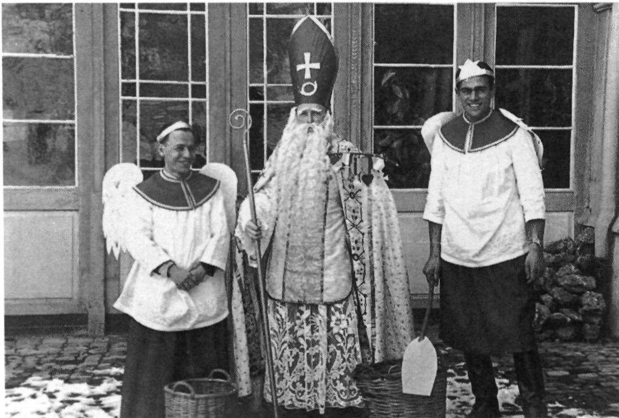
«In unserer Trübsal musste uns St.Nikolaus trösten», Herisau/Heinrichsbad, Weihnachtsfeier 1943. (Petruszka)

Im Februar 1943 zog man alle Studenten im ehemaligen Kurhaus Heinrichsbad zusammen, an dessen Stelle bis auf die Dependance heute ein neueres Alters- und Pflegeheim steht. Das Jahr 1943 brachte allgemein Erleichterungen und Lockerungen im militärischen Lageralltag. Zur Veränderung trug die gewandelte aussenpolitische Lage bei. Deutschlands Sie-