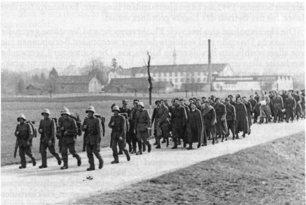
«Anmarsch zum Friedhof Herdern», Frühling 1941. (Petruszka)

Nachdem sich der Schulbetrieb Ende des ersten Semesters einigermaßen eingespielt hatte, wurde das IHSL in den Semesterferien vom 17. März bis 10. April 1941 zum Arbeitseinsatz abkommandiert. Das Roden von 67 a Wald in Herdern bei Frauenfeld war eine körperlich anstrengende Arbeit.