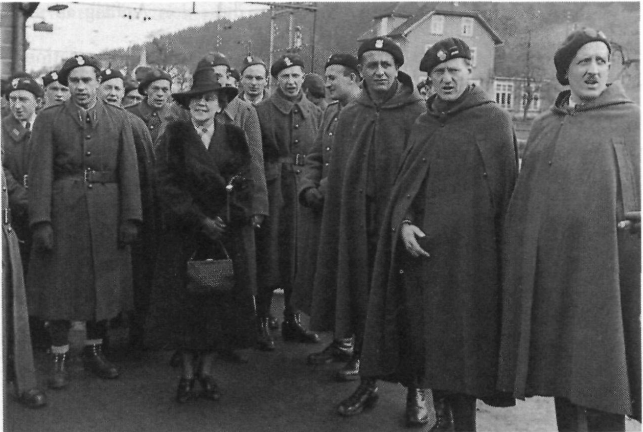
«Der beliebten Dozentin der russischen Sprache wird ein herzlicher Empfang bereitet», Sirnach 1940/41.