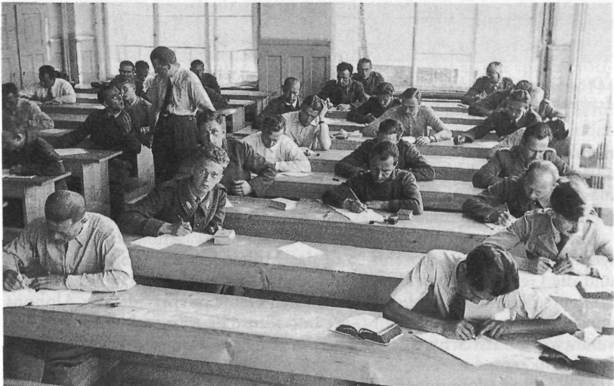
«Juli – es wird immer heisser, besonders bei den Prüfungen», Herisau 1942. (Petruszka)

Seine positive Einschätzung basierte auf einer Zukunftsvision, die aufklärerisches Gedankengut enthielt und auch von den Hochschullehrern geteilt wurde. Allerdings ging der Offizier davon aus, dass die Polen nach dem Abschluss ihrer Studien in ihre Heimat zurückkehren würden: «Wenn diese Polen in den beiden Hochschullagern die Nerven behalten und ihre Studienpflichten gut erfüllen, so werden notwendigerweise die führenden Köpfe eines vielleicht neu entstehenden polnischen Staates auf zwei Generationen hinaus zum grossen Teil ehemalige Winterthurer und ehemalige