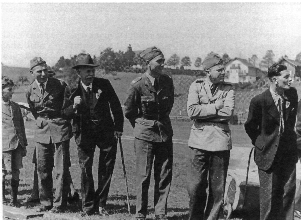
Sportereignis vor der Kaserne Herisau. (?)