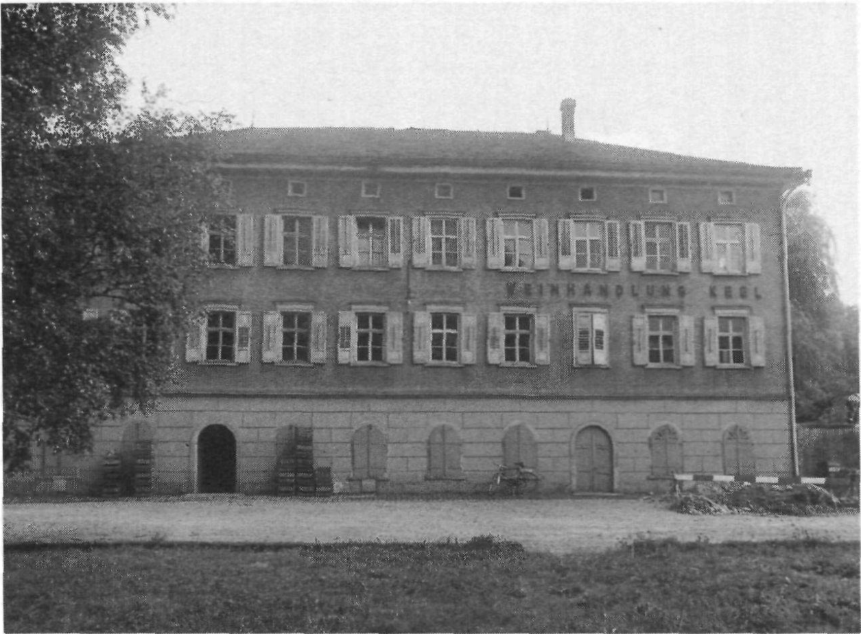
Weinhandlung Keel, Dorfmühle Gossau.

Die Frauen erhielten anonyme Briefe und Telefonate und bekamen Anstände, denn «im Prinzip war es ja verboten», was sie taten. Ihr Einsatz für die Internierten hat ihnen sicher geschadet, aber das behielten sie für sich. Es erforderte Mut und wohl auch ein wenig Trotz, den Leuten zu begegnen, die hinter vorgehaltener Hand flüsterten.