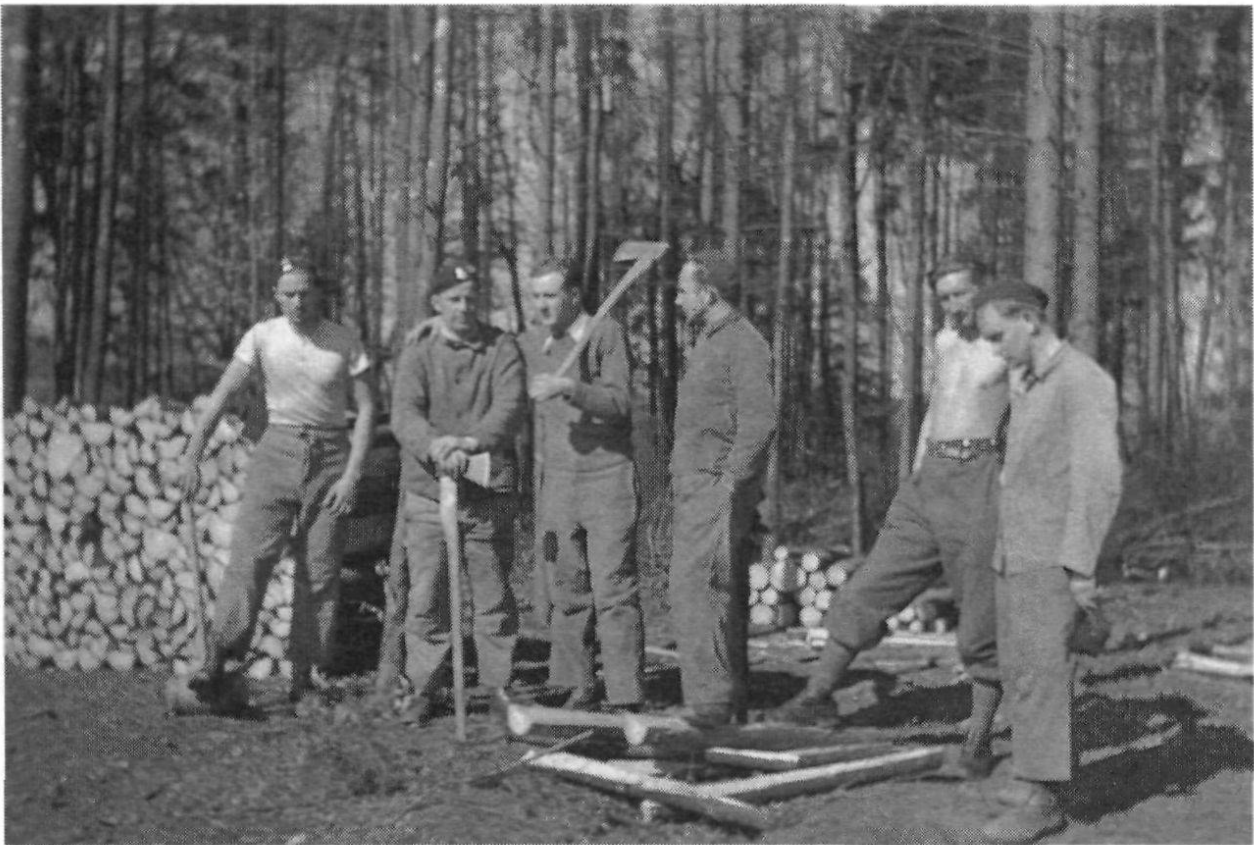
Bei Waldarbeiten, Herdern, Frühling 1941.