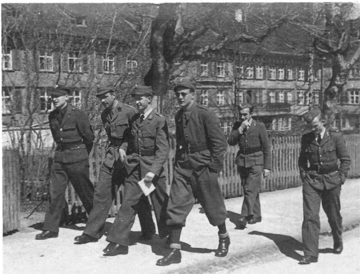
«Oberschlesier», zum Teil in englischen Uniformen vor dem Heinrichsbad, Herisau 1943. (Rucki)

Die Fluktuation unter den Studenten des IHSL Herisau war gross: Zu Beginn waren es 119 Internierte, zu denen 17 hinzukamen, 53 schieden aus, 23 fielen durch und 40 schlossen ab. 72) Ein Kommilitone starb im Mai 1944 nach mehrmonatiger Erkrankung an Lungenentzündung. 73)