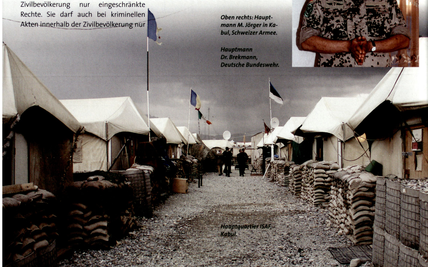
Hauptquartier ISAF, Kabul.