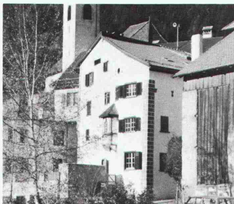
Felsberg/GR: Das 300-jährige Haus am Stutz ist saniert. Das Problem der feuchten Mauern wurde durch die Renesco gelöst.