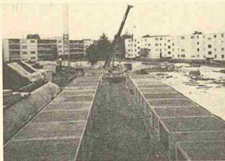
Frisba-Tiefgarage in Volketswil

Das Frisba-Tiefgaragen-System sieht eine Einstellhalle mit vorgefertigten Einzelboxen in Verbundbauweise vor. Die Boxen werden auf Fundamentstreifen reihenweise einander gegenüber aufgestellt. Über die Boxen wie