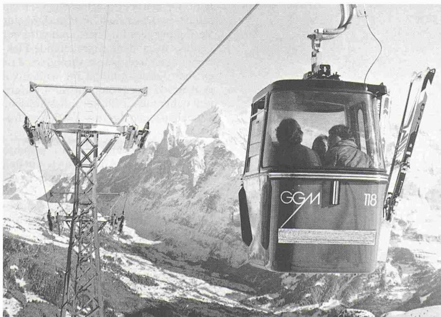
In den Skiferien verbrauchen wir rund zehnmahl mehr Strom als daheim. Daraus resultieren sehr hohe Winterspitzen im Elektrizitätsbedarf der Winterkurorte

Angenommen wird bei dieser Berechnung, dass die Familie während der gesamten Feriendauer dreizehnmal in einem Mittelklasshotel übernachtet und an zwölf Tagen jeweils zehn Skiliftfahrten pro Tag absolviert. Aus diesem hohen Pro-Kopf-Verbrauch der Feriengäste resultieren die sehr hohen Winterspitzen im Stromverbrauch bei den Kurorten: In St. Moritz beispielsweise liegt die Nachfrage nach elektrischer Energie um die Jahreswende zwischen drei- und viermal höher als der Bedarf im «toten» Monat Mai.