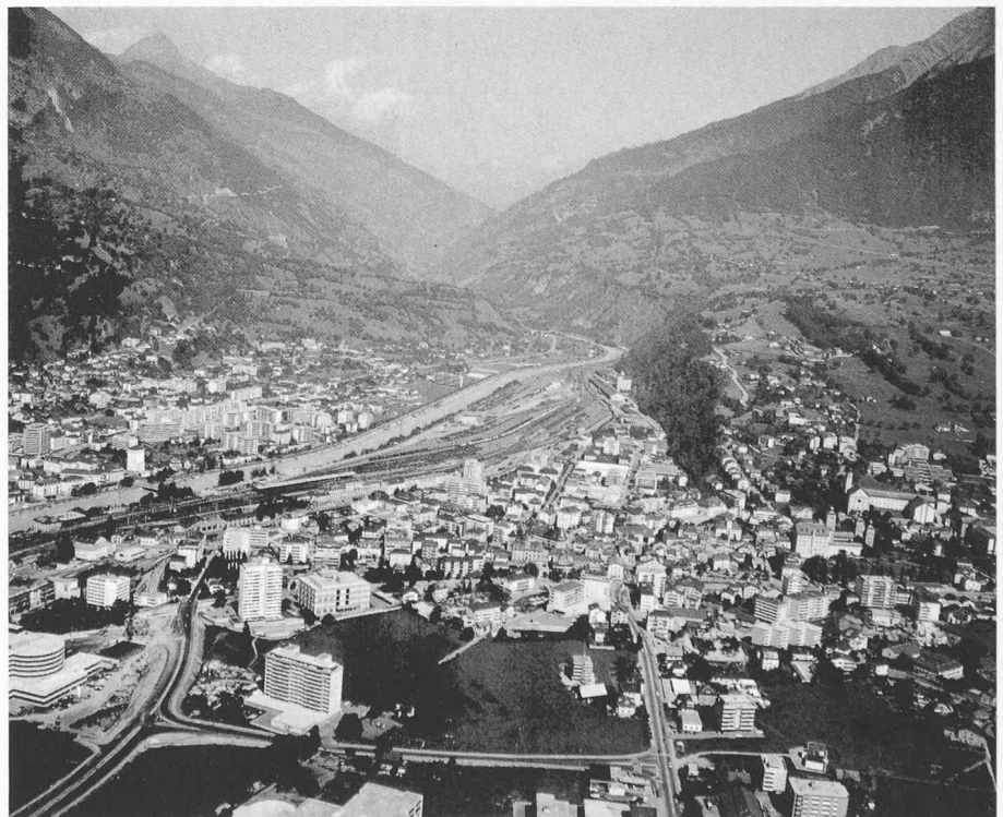
Bild 1. Luftaufnahme des Gebietes Brig/Glis und Naters

Die Bebauung in Brig-Glis ist eingezwängt zwischen Bahnhof und dem ansteigenden Hügel Richtung Stockalper-Schloss. Die Überbauung im Kern ist sehr dicht; die Bauten stehen an einem rechtwinkligen Strassennetz. Die Gebäude beschatten sich gegenseitig sehr stark, und im südlichen Stadtteil bleibt die Sonne im Winter bis zu 2 Monaten wegen dem steil ansteigenden Glishorn gänzlich weg.