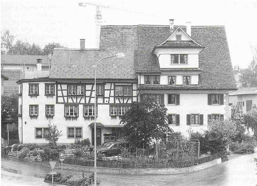
Seit 1981 statistisch belegt: Der Trend «aufs Land» hält an. Die Wohnbevölkerung in ländlichen Gemeinden wächst deutlich stärker als in den Städten. Sicherlich trägt dazu bei, dass in diesen Gemeinden immer mehr Wohnraum durch Umnutzungen und Sanierungen geschaffen wird

Die Kantone Schwyz (1,7%), Thurgau und Genf (je 1,6%) verzeichneten die grössten prozentualen Bevölkerungszunahmen, die deutlich über dem Schweizer Mittel von 0,8% liegen. Als einziger Kanton hatte Basel-Stadt einen Rückgang der Wohnbevölkerung (-0,9%) zu verbuchen.