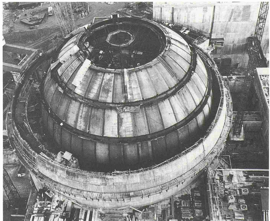
Bild 4. Bau des Containments für das KKW Gösgen, Stand Januar 1976

gegen die das Kraftwerk ausgelegt wird. Die Auslegungsstörfälle werden so beherrscht, dass bei realistischer Betrachtung eine beachtliche Sicherheitsmarge übrigbleibt. Damit können sowohl allfällige Kenntnislücken wie auch noch schlimmere Ereigniskombinationen mit abgedeckt werden. Darüber hinaus sind auch Vorkehrungen zum Schutz gegen Sabotage und ähnliche Einwirkungen getroffen.