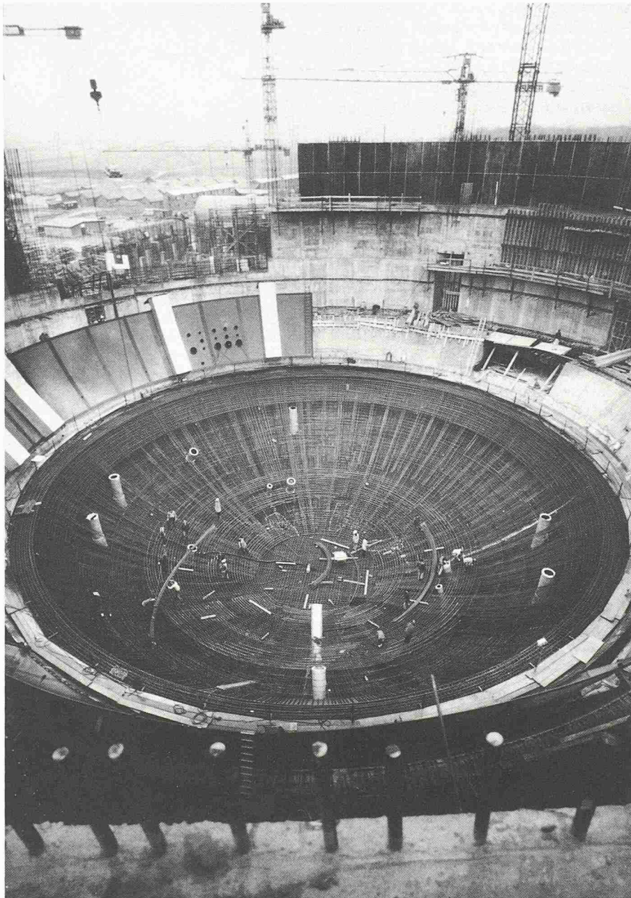
Bild 2. Bau des Containments für das KKW Gösgen, Stand Januar 1975