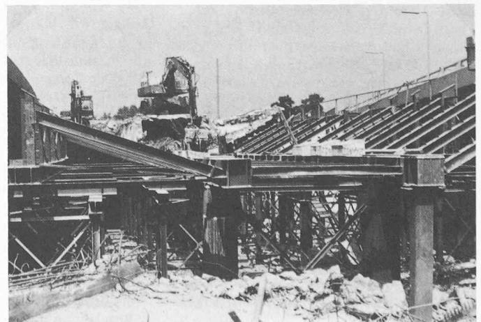
Bild 3. Abbruch der Nordbrücke mit einem japanischen 120-t-Betonbeisser Kami Kami auf Stahlgerüst, das auch als Lehrgerüst für die neue Brücke dient