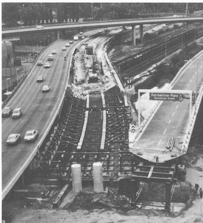
Bild 2. Übersicht. Der Verkehr rollt 4spurig über die mit Stahlkonstruktionen unterfangene Südbrücke

Wiederum musste die Brücke sofort für Lastwagen gesperrt werden, und der verbleiben-