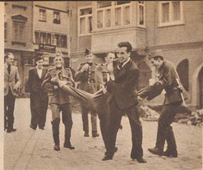
Plötzlich ist ein Ahnungsloser gepackt worden... Soudain ils se saisissent d'un de leurs camarades...

Die französische Regierung hat nach Kenntnisnahme eines — naturgemäß nur höchst unverbildlichen — Voranschlags einen Betrag von 204 Millionen Francs bewilligt, der für die Wiederherstellung der durch Kriegshandlungen beschädigten oder zerstörten Bauten und historischen Monumente verwendet werden soll. Natürlich handelt es sich hier lediglich um den auf das Jahr 1940 entfallenden Budgetposten, da die vollständige Beseitigung und Wiedergutmachung der Zerstörungen wohl ein Vielfaches dieses Betrages beanspruchen wird.