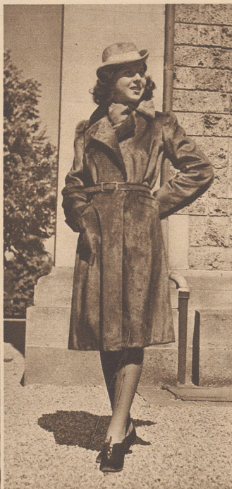
Sportmantel aus rehbraunem Otterpelz. Loutre de rivière.