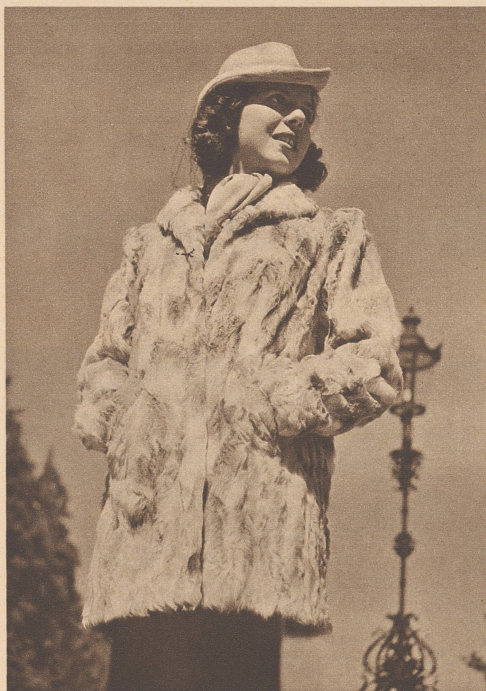
Jacke aus Persianerpfote, deren Farben zwischen weiß, elfenbeingel und hellgrau spielen. Agneau de Perse.

Bonne nouvelle pour les skieurs. Une galerie longue de 770 m. fut établie au cours de l'été pour protéger la voie ferrée du Gornergrat des avalanches. Le trafic ferroviaire qui, durant l'hiver, se trouvait jusque là arrêté à Riffelalp, devient désormais possible jusqu'à Riffelberg, permettant aux skieurs d'accéder à de nouveaux champs de neige.