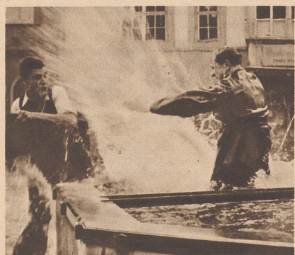
Aber er wehrt sich und spritzt! Le baigneur, malgré lui, entreprend aussitôt de se défendre.