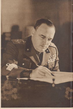
General Ubaldo Soddu Oberstabschef im Generalstab des Heeres. Général Ubaldo Soddu, maréchal de l'E. M. de l'armée.