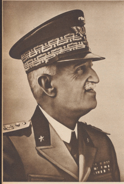
Viktor Emanuel III. König von Italien und Kaiser von Äthiopien, ab 1929 Befehlshaber aller italienischen Land-, See- und Luftstreitkräfte. S. M. Victor Emmanuel III, roi d'Italie et empereur d'Éthiopie, chef suprême des armées de terre, de mer et de l'air.