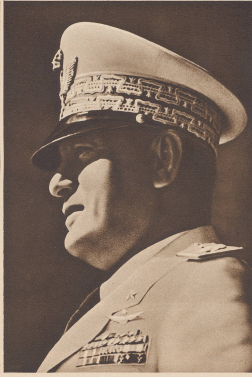
Benito Mussolini Ministerpräsident, Regierungschef, Kommandant sämtlicher Truppen mit allen Titeln und Ehren. Marschall des Imperiums. S. E. Benito Mussolini, président du conseil des ministres, ministre de la guerre, commandant en chef des troupes combattantes sur tous les fronts, premier maréchal de l'Empire.