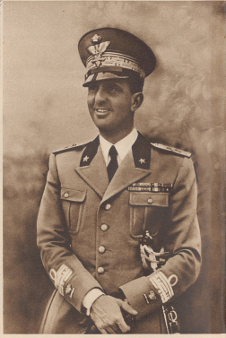
Umberto di Savoia Prinz von Piemonte, Kronprinz von Italien seit 1928. Generalinspektor der italienischen, Oberkommandierender der Heeresgruppe Nord. S. A. R. et J. Humbert de Savoie, Prince de Piémont, héritier de la Couronne d'Italie, inspecteur général de l'Infanterie et chef des armées du Nord.