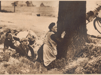
Auf der Flucht auf belgischen Straßen. Ein Stück weit sind die Leute zu Rad mit ihren paar Handkoffer gekommen. (Passage de la Meuse) In Graven sind hinter den Bäumen der Landstraße ein viertel Schütz zu finden.

Des fugitifs belges à bicyclette, sur une route de campagne en Belgique, cherchent un abri dans les haies et derrière un arbre lorsque paraissent les avions allemands.