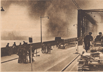
Deutsche Panzertruppen vor dem Einmarsch in das brennende Rotterdam. Nachdem am 11. Mai die Deutschen Bomben zum vierten Mal auf die Stadt geschlagen und einen großen Teil der Geschäfts- und Wohnviertel in Trümmer gelagert hatten, wurde vier Tage lang erbittert in den Straßen gekämpft, bis zur Kapitulation am 15. Mai. Rotterdam hat die größten Verluste aller holländischen Städte an Menschenleben zu verzeichnen. Die Schätzungen variieren zwischen 15 000 und 50 000.

Des unités blindées allemandes avancent dans Rotterdam en flammes. Après la première attaque des bombardiers allemands par la ville, le 11 mai, une grande partie des maisons d'habitation et de commerce furent détruites, et des latrues sauvages se dressèrent dans les rues de la ville, jusqu'au moment de la capitulation, le 15 mai. De toutes les villes hollandaises, Rotterdam compte le plus grand nombre de victimes.