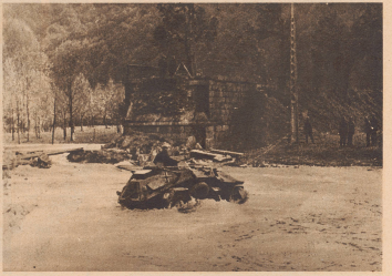
In Frankreich, am Oberlauf der Flusse Lys, in den Höhen westlich von Arras: ein deutscher Tank erzwang gleich neben der gesprengten Brücke den Übergang über das Wasser. À l'endroit où le pont fut détruit, sur le cours supérieur de la Lys, à Pœvres d'Arras, un tank allemand traversa la flèche dans l'eau.