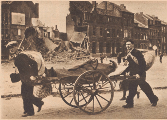
Belgische Schicksale: Der Vater ist krank, auf einem Schubkarren rollen die Säbten bis aus dem Städtchen. Sur une charrette à bras, cet homme emporte son père malade, à travers les rues d'une petite ville.