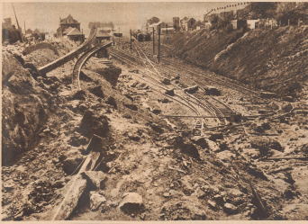
Von Bombenwürfen zerstörte Bahnhöfe in Belgien. Voies ferrées de Belgique détruites par les bombardements.

Des fugitifs belges à bicyclette, sur une route de campagne en Belgique, cherchent un abri dans les haies et derrière un arbre lorsque paraissent les avions allemands.