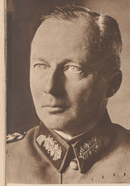
Generaloberst von Kluge Oberbefehlshaber der 6. Armee. Generaloberst von Kluge, cdt en chef la 6 e armée.