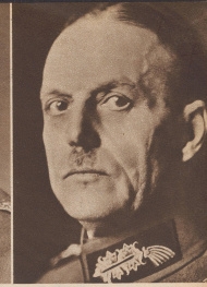
Generaloberst von Rundstedt Oberbefehlshaber des Heeresgruppenkommandos Berlin. Generaloberst von Rundstedt, cdt en chef du corps d'armée de Berlin.