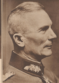
Generaloberst von Bock Oberbefehlshaber der 1. Armee. General von Bock, cdt en chef la 1 re armée.