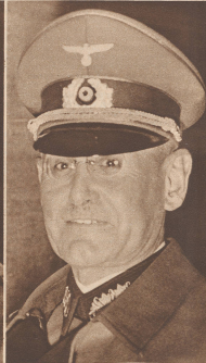
General der Artillerie Halder

Chief des Oberkommandos der Wehrmacht. Er ist der höchste militärische Verwaltungsbeamte, etwa mit dem Chef des Kaiserlichen Militärkabinetts zu Wilhelm II. Zitiert vergleichbar, eine Art Biurokrat, der die reibungslose Zusammenarbeit der Wehrmachtsteile gewährleisten soll. Generaloberst Wilhelm Keitel, chef du commandement suprême de l'armée. Ses fonctions correspondent à celles qu'assumait sous Guillaume II, le chef de cabinet militaire de l'empereur. C'est à lui qu'incombe de faire coordonner les activités des armées de terre, de mer et de l'air.