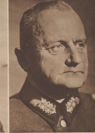
General der Artillerie Haase Oberbefehlshaber des 5. Armeekorps. General der Artillerie Haase, cdt en chef la 5 e armée.