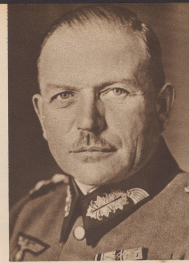
General Guderian Führer eines Panzerkorps und Inspekteur der schnellen Truppen. General Guderian, cdt un corps de tanks et inspecteur des troupes motorisées.

Dans son No 48 du 1 er décembre 1939 ZI a présenté les visages des chefs de l'Armée anglaise de même que dans son No 42 du 20 octobre elle a présenté les chefs de l'Armée française. Voici aujourd'hui les portraits de ceux qui président aux destinées militaires du Reich.