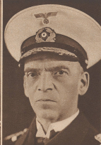
Konteradmiral Schniewind Chief des Stabes der Seekriegsleitung, auch Großadmiral Raeder der höchste Offizier der deutschen Kriegsmarine. Contre-amiral Schniewind, chef d'état-major de la marine de guerre.