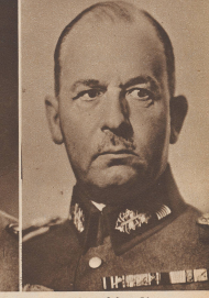
Generaloberst List Oberbefehlshaber der 14. Armee. Als Major kommandierte List im Krieg 1914—1918 das Regiment, in dem Hitler als Gefreiter diente. Generaloberst List, cdt en chef la 14 e armée. Fut durant la guerre 1914—1918 major de régiment où Hitler servit en qualité d'apprenti.