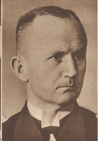
Konteradmiral Dönitz Chief der deutschen U-Boote-Flotte. Contre-amiral Dönitz, chef des sous-mariniers.