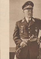
Generalleutnant Göring Oberbefehlshaber der Luftwaffe. Le maréchal Göring, chef des forces aériennes.