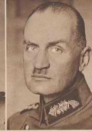
Generaloberst von Blaskowitz Oberbefehlshaber der 8. Armee. Generaloberst von Blaskowitz, cdt en chef la 8 e armée.