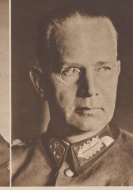
General von Reichenau Oberbefehlshaber der 10. Armee. General von Reichenau, cdt en chef la 10 e armée.