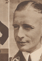
Generalmajor Jeschonnek Chief des Generalstabes der Luftwaffe. Generalmajor Jeschonnek, chef de l'état-major général de l'air.