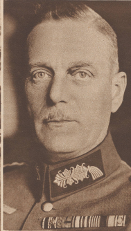
Generaloberst Wilhelm Keitel

Oberbefehlshaber des Heeres. Er hat von allen Militärs den größten Einfluß auf die Gesamtkriegsführung und ist in seinen Funktionen etwa mit dem Chef des Großen Generalstabes im Krieg 1914—1918 vergleichbar. Über ihn steht nur noch Hitler, der ihn «Cheerful Führer des Wehrmacht» nennt. Generaloberst Heinrich von Brauchitsch, cdt en chef de l'armée. Son opinion est prédominante dans le commandement opérationnel. Ses fonctions correspondent à celles du Grand Quartier-Maître pendant la guerre de 1914—1918. Seul Hitler, chef suprême des forces armées, peut mettre un veto à ses décisions.