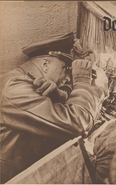
Generaloberst Heinrich von Brauchitsch

Oberbefehlshaber des Heeres. Er hat von allen Militärs den größten Einfluß auf die Gesamtkriegsführung und ist in seinen Funktionen etwa mit dem Chef des Großen Generalstabes im Krieg 1914—1918 vergleichbar. Über ihn steht nur noch Hitler, der ihn «Cheerful Führer des Wehrmacht» nennt. Generaloberst Heinrich von Brauchitsch, cdt en chef de l'armée. Son opinion est prédominante dans le commandement opérationnel. Ses fonctions correspondent à celles du Grand Quartier-Maître pendant la guerre de 1914—1918. Seul Hitler, chef suprême des forces armées, peut mettre un veto à ses décisions.