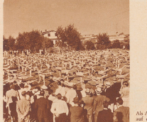
Als Abschluss der Arbeit auf dem Platz der Geräteübungen. Die besten weiblichen Turnkünstlerinnen aus einem Einzugsgebiet von mehreren tausend Schweizer Turnern nahmen an diesem Turnfest teil. Die Teilnehmerinnen waren keine Gelehrten zum gemeinsamen Festen geübt, aber diese Geräteübung hinter sich auf jedem schwereren Platz schon besser geübt.