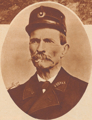
Der französische Briefträger Ferdinand Cheval von Hauterives, der Erbauer seines «Idealschlusses» in der Landschaft La Drôme.

Ferdinand Cheval, postier d'Hauterives (Drôme), six ans avant l'achèvement de son «palais idéal».