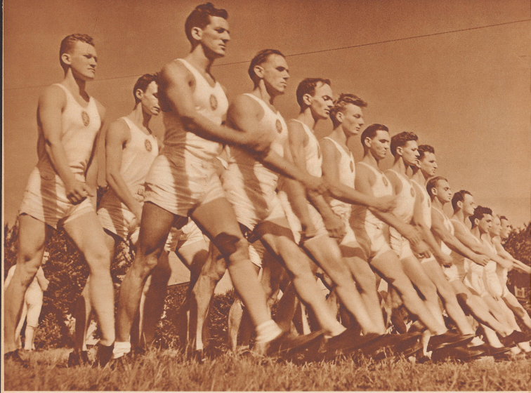
Wie dahin auf dem Turnplatz. Die feste Schöpfung Hudson County bei den Marschübungen. In den Mannschaftswettbewerben errang Hudson County mit 145,25 Punkten die Siegespalme, die ihm seit 1918 dazumal beschinden war. La section d'Hudson County à grande allure aux exercices de marche. Elle gagna le championnat d'équipes avec 145,25 points. Depuis 1918, c'est la 13e fois!