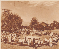
Blick auf das Schwimmbad in Kane's Park. 18 Namen verzeichnet die Liste der Konkurrenten in unserem Nationalturnfest. Die Leistungen waren, an humanitären Begriffen gemessen, nicht überausglänzend, schreibt unser Berichterstatter vom Genéveve.