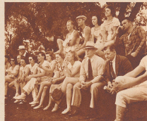
Zuschauer beim Schwimmrennen im städtischen Gelände des Kane's Parks. Es sind meistens Leute aus Missouri und Paterson, Schwitzer, die schon in Amerika geboren sind, aber schwerverständlich noch sprechen.