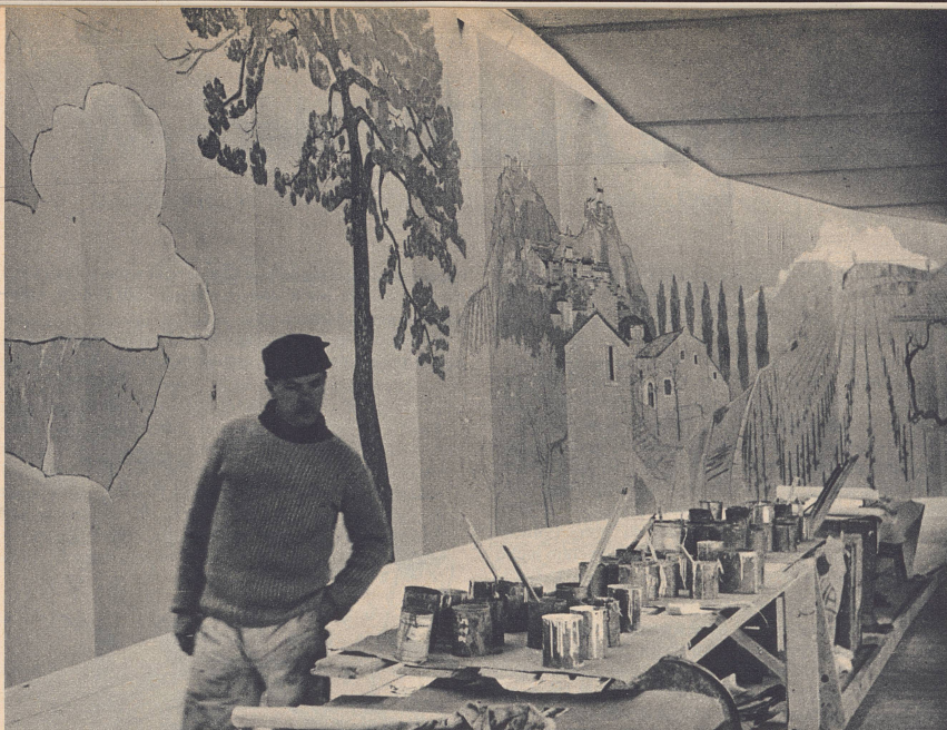
Hier seht ihr einen Maler vor einer Wand, die er schon teilweise bemalt hat. Er überlegt gerade, ob er den Himmel blau oder grau malen soll. Essayez de faire aussi bien et mieux encore que cet artiste dont vous voyez la fresque!