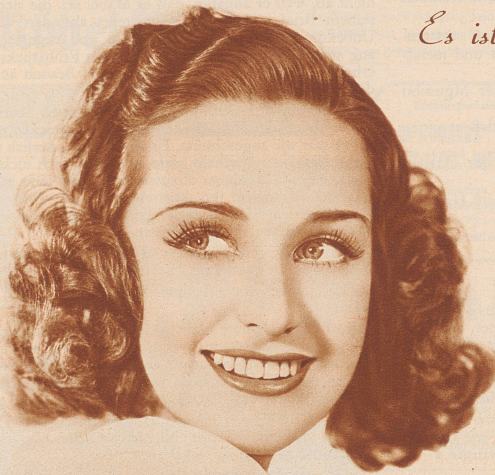
Rosemary Lane, Star of Warner Bros. Pictures, appearing in "Four Daughters".

Es ist eine wahre Freude, sich die Zähne mit IRIUM-haltigem Pepsodent