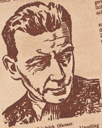
Friedrich Glauser. (Bildnis von Max Billeter auf dem Umschlag des besprochenen Buches.)

E. F. Friedrich Glauser, der im Dezember 1938 als dreiundvierzigjähriger starb, war eine der merkwürdigsten Gestalten des neuern schweizerischen Schrifttums. Schon dem Herkommen nach den gegensätzlichsten geistigen Bezirken zugehörig und verschiedenen Lebens- und Bildungswelten verpflichtet, außerdem unzweifelhaft mit dem Erbteil abenteuerlicher Ausschweifungen be'astet und durch den frühzeitigen Verlust seiner Mutter seelisch für immer überschattet, hat er doch, als er Sammlung und Kraft zum Schreiben und Gestalten fand, den charakteristisch schweizerischen Kriminal-, den