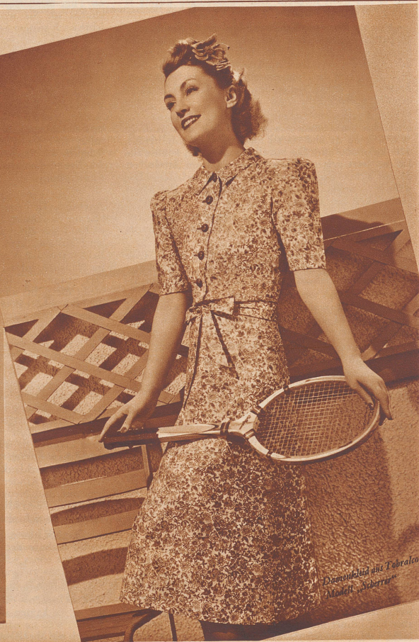
Damenkleid aus Tobralco Modell „Suzanne“