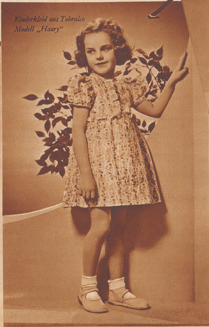
Kinderkleid aus Tobralco Modell „Hanny“

der ideale Stoff für Frühjahr und Sommer