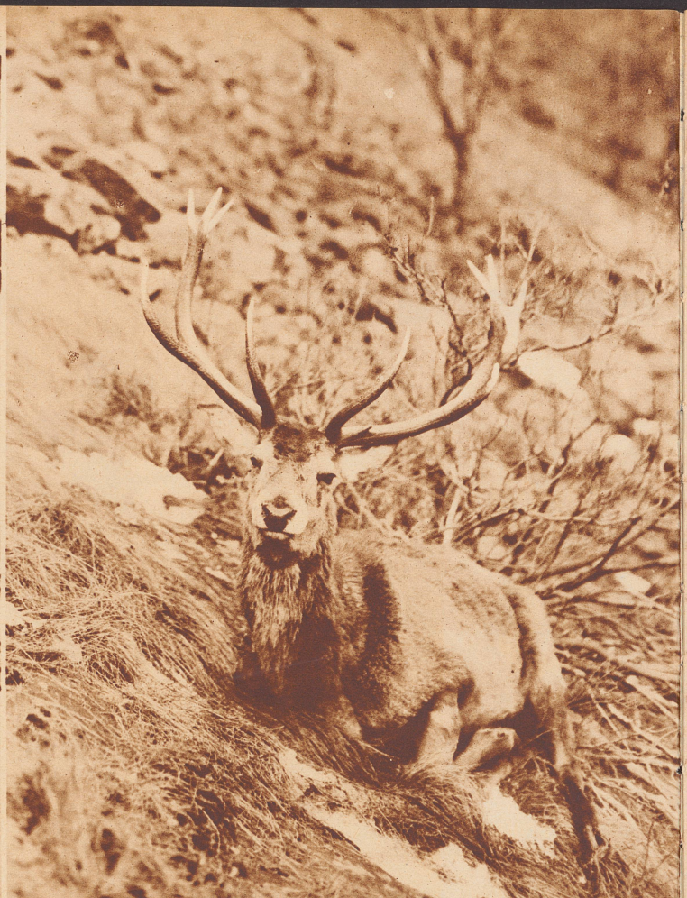
Wintermüder Hirsch im Sonnenbad des Frühlings