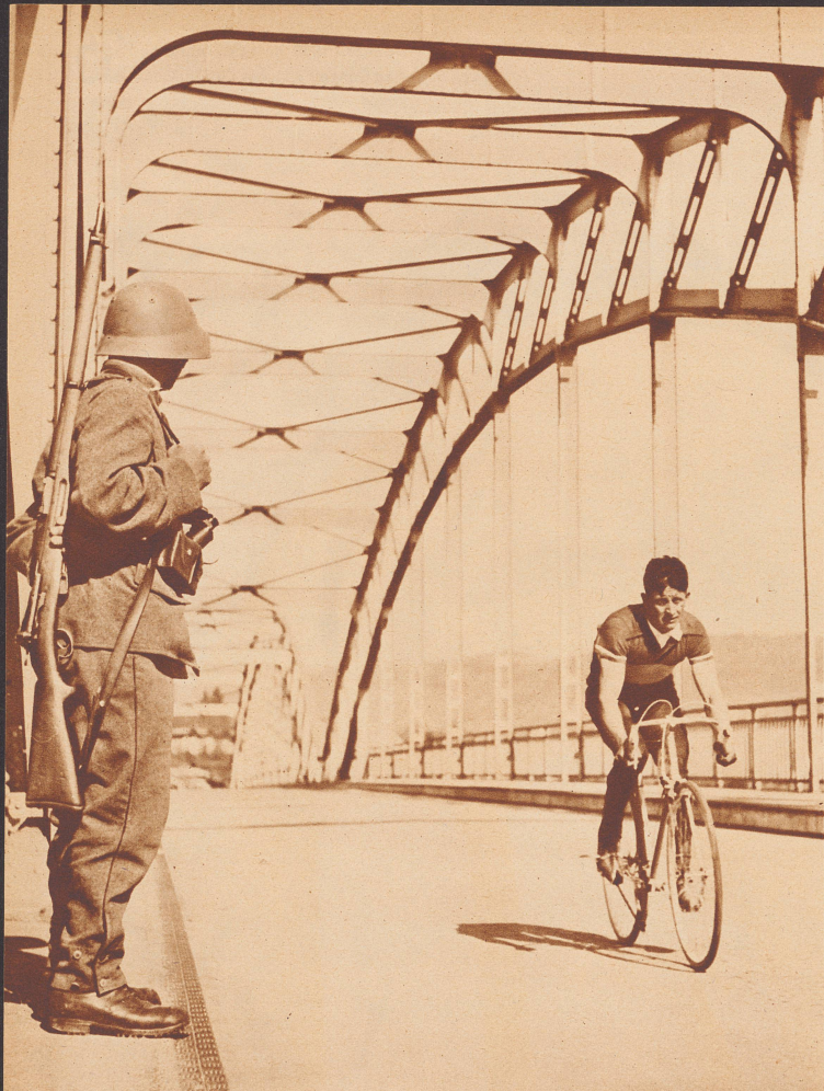
Das Rennen der 730 Mann